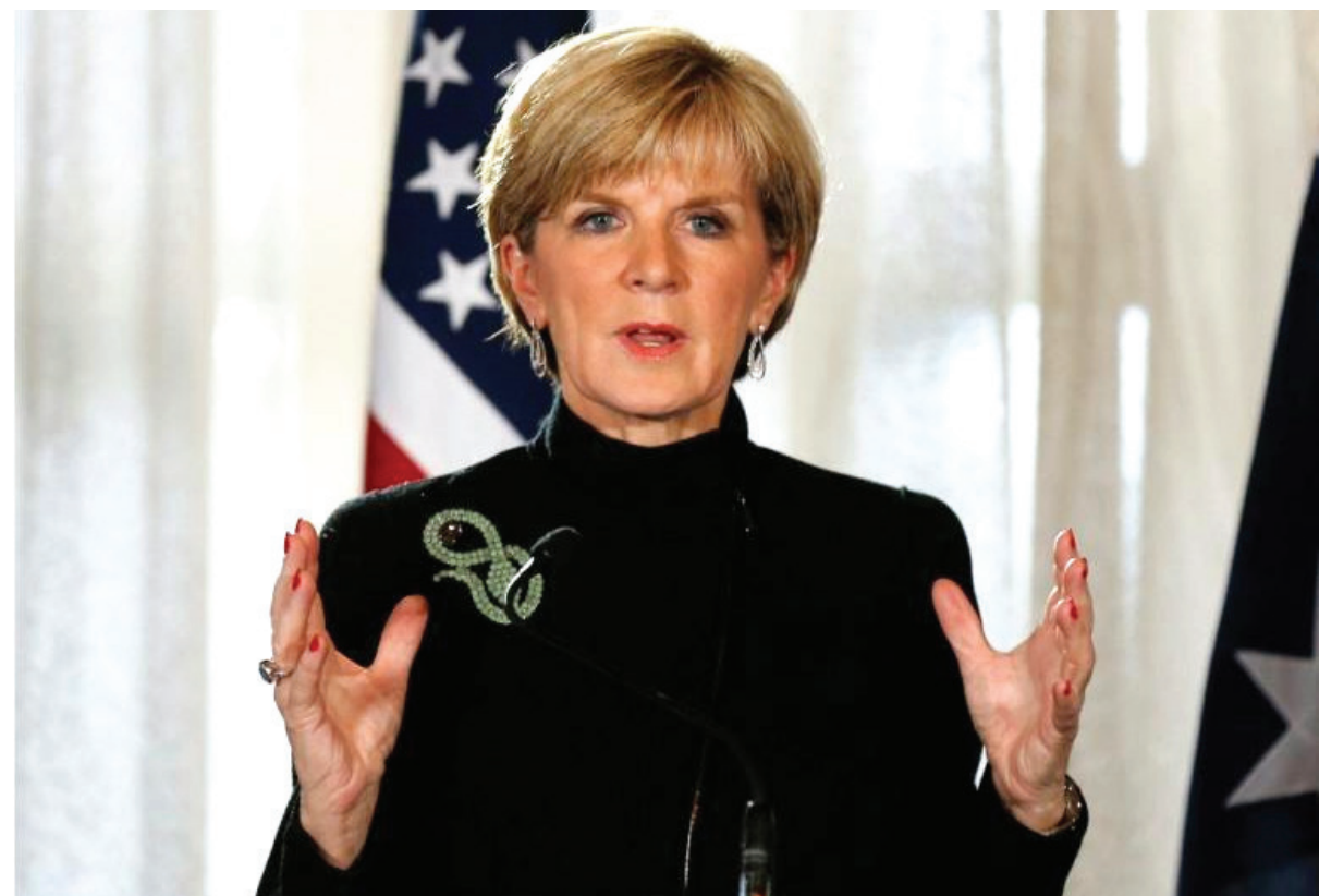
جولی بیشاپ، وزیر امور خارجه استرالیا گفته است که توافق کشورش با ایران برای تبادل اطلاعاتی از جمله در عراق به مقابله تهران و کانبرا با داعش کمک خواهد کرد. به گفته این مقام استرالیایی که به اخیرا تهران سفر کرده، بر اساس این توافق استرالیا می تواند به اطلاعاتی

کنند. خانم بیشاپ این سخنان را کمی پس از دیدار با مقام های ارشد ایران مطرح کرد. گفته می شود حدود ۱۰۰ تبعه استرالیا برای جنگ در کنار نیروهای داعش به سوریه و عراق سفر کرده اند. مقام های استرالیا می گویند که این عده در عین حال خطری جدی برای امنیت داخلی این کشور هستند. روز شنبه ۵ توجان به اتهام تلاش برای حمله به مراسم صدمین سالگرد جنگ جهانی اول دستگیر شدند. جولی بیشاپ به خبرگزاری استرالیا گفت که ایران و استرالیا در مقابله با داعش و حمایت از دولت عراق هدفی مشترک دارند. وزیر امور خارجه استرالیا بدون اشاره به اینکه در این مشارکت اطلاعاتی تهران چه به دست می آورد گفت: ایران اطلاعاتی دارد که ما به دنبال هستیم و آنها نیز موافقت ولی من از جزئیات همکاری اطلاعاتی صحتی نمی کنم. خانم بیشاپ گفته است که کشورش در سال ۲۰۱۴ موضوع مشارکت اطلاعاتی با ایران را بررسی کرد. به گفته او این موضوع در دسامبر ۲۰۱۴ با گروگان گرفته شدن ۱۸ نفر به مدت ۱۷ ساعت توسط هارون مونس (محمدحسن منطقی)، یک پناهنده ایرانی، در کافه ای در سیدنی اهمیت بیشتری پیدا کرد. در حمله پلیس برای آزاد کردن گروگان ها، هارون مونس و دو نفر از گروگان ها کشته شدند. مقامات وزارت امور خارجه ایران در آن زمان گفتند که بیشتر در مورد این فرد به مقامات استرالیایی هشدار داده بودند. خانم بیشاپ روز