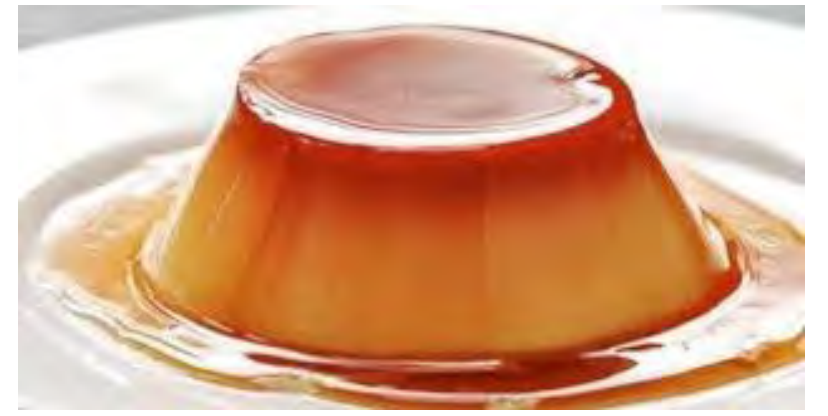
مواد لازم کرم اسپرسو تخم مرغ : ۶ عدد شیر : ۳ پیمانه شکر : ۳/۴ پیمانه وانیل خالص : ۱/۲ قاشق چایخوری اسپرسو دم کشیده غلیظ : ۱/۲ پیمانه