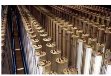
در دهه گذشته، کشورهای غربی بارها از برنامه هسته‌ای ایران ابراز نگرانی کرده‌اند. شورای امنیت سازمان ملل نیز تحریم‌هایی علیه ایران اعمال کرد. در سال ۲۰۱۵، ایران و قدرت‌های جهانی به توافق برجام دست یافتند که بر اساس آن، برنامه دیگر تهران محدود و نظارت‌پذیر شد و در مقابل، تحریم‌های بین‌المللی تدریجی کاهش یافت. سال گذشته با خروج آمریکا از برجام و بازگشت

یکجانبه تحریم‌ها، ایران اعلام کرد با استناد به ندهایی از برجام، تعهدات خود را کاهش می‌دهد. ایران تا کنون با اعلام سه ضرب‌الاجل شصت روزه تعهدات خود را در برجام کاهش داده است. در سومین مرحله کاهش تعهدات، ایران اعلام کرد مجدداً تحقیقات سانتریفوژهای پیشرفته را آغاز خواهد کرد. کشورهای اروپایی عضو برجام هشدار داده‌اند در صورتی که ایران به تهدیدش عمل کند و گام بعدی در کاهش تعهداتش را بردارد، آنها نیز از این توافق خارج خواهند شد. ایران همواره تأکید دارد که به دنبال ساخت بمب اتمی نیست و هدفش از برنامه هسته‌ای، تولید برق و مصارف پزشکی و کشاورزی است. آیت‌الله علی خامنه‌ای، رهبر ایران هم اخیراً بار دیگر فتاوی خود مبنی بر حرام بودن استفاده از بمب هسته‌ای را یادآوری کرد اما همزمان خواستار استفاده از ظرفیت علمی کشور برای پیشرفت فناوری صلح‌آمیز هسته‌ای شد.