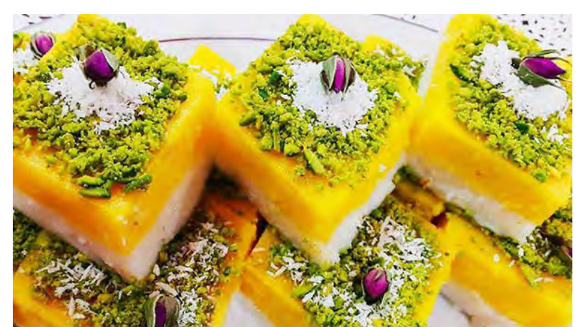
مواد لازم حلوائ شیرازی آرد برنج اعلا : ۱ پیمانه شکر : ۲ پیمانه آب : ۲ پیمانه گلاب : ۱ پیمانه زعفران : ۱/۲ پیمانه (حل شده)