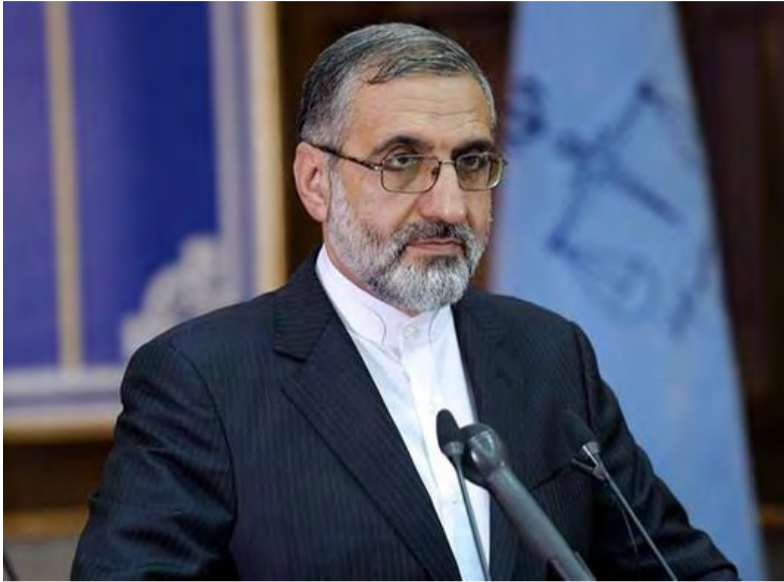
مجلس در توثیق نوشت چهار رابط روح‌الله زم در جریان دستگیری‌های مرتبط با نارامی‌های دی ۹۶ در قوای مجریه و قضائیه تحت تعقیب قرار گرفته‌اند.