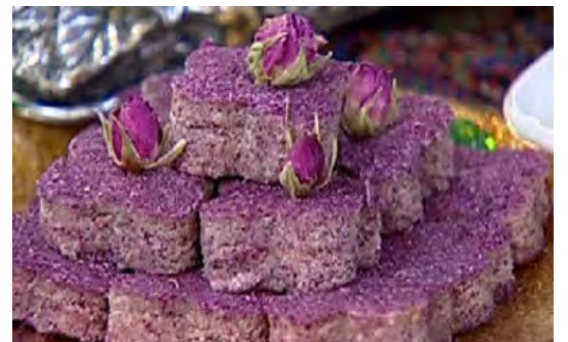
حلوائ گل محمدی نوعی حلوائ مقوی و پرخاصیت تهیه شده از آرد گندم و پودر گل محمدی است که دارای عطر فوق العاده ای بوده