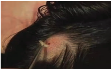
معمولا داخل روده ها، خون یا بافت بدن زندگی