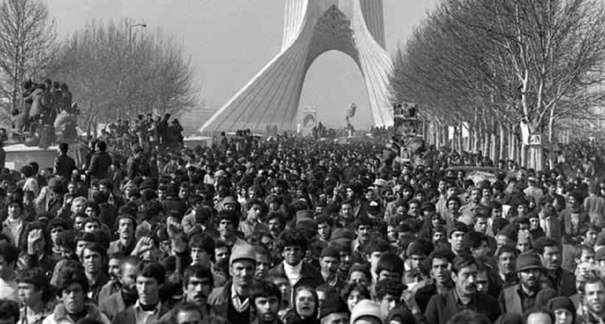
دانشجویان در تظاهرات ۱۳۵۷

نفی رژیم پهلوی در ایران، پدیده‌ای است عظیم و اجتماعی، اما نه به این معنا که سردرگم و عاطفی باشد، یا به خود چندان آگاهی نداشته باشد، به عکس شیوه انتشارش بسیار کارآمد است از اعتصاب‌ها به تظاهرات، از بازارها به دانشگاه‌ها، از تراکت‌ها به پیشگویی‌ها و واسطه انتشارش هم بازاریان و روحانیان و کارگران و استادان و دانشجویان‌اند» میشل فوکو، ایرانی‌ها چه رویایی در سر دارند؟