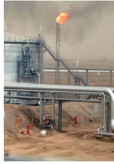
تأسیسات نفتی عربستان سعودی را هدف قرار

دادند. در پی این حمله و توقف انتقال نفت از این خط لوله، قیمت نفت در بازار جهانی بالا رفت. عربستان این حمله را تروریستی خوانده است. شبکه تلویزیونی العسیره که به حوثی‌های یمن نزدیک است گزارشی داد که این گروه تأسیسات نفتی عربستان سعودی را هدف قرار داده است. این شبکه تلویزیونی خبر این حمله را به نقل از یکی از مقامات ارشد حوثی که نتوانست نامش فاش شود، منتشر کرد. این مقام یمنی گفته حمله با استفاده از هفت پهپاد انجام شده است. او گفته حوثی‌ها آماده‌اند تا عملیات بیشتر و سنگین‌تری را بی‌ریزی کنند. هزرم، وزارت انرژی عربستان تأیید کرده است که در این حمله هدف، خط لوله نفت شرق به غرب این کشور هواباز قرار گرفته است. بنا بر اعلام این وزارتخانه، تا زمان ارزیابی خسارت‌ها می‌تواند از خط لوله شرق به غرب قطع خواهد بود. به گزارش رویترز، در پی انتشار خبر این حمله، قیمت نفت در بازارهای جهانی بالا رفت و قیمت