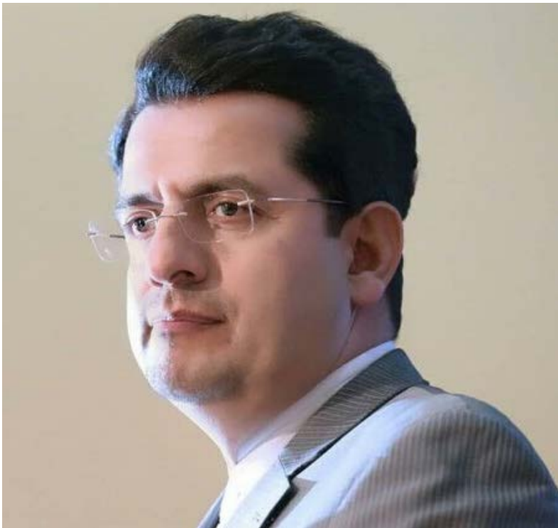
عباس موسوی، سخنگوی وزارت خارجه جمهوری اسلامی، گزارش اخیر خبرگزاری رویترز درباره شرط ماندن ایران در توافق هسته‌ای این کشور با قدرت‌های بزرگ جهانی را رد کرده است. به گزارش رسانه‌های ایران، آقای موسوی امروز سه‌شنبه (۲۳ اردیبهشت) در جمع خبرنگاران گفته است: پرداختن به این گونه خبرسازها و گمانه‌زنی‌های ناقص و غیردقیق در فضای

از چهار منبع اروپایی همچنین گفته بود این رقم (۱.۵ میلیون بشکه نفت) در دیدار اخیر مقامهای اروپایی و ایرانی شامل محمد جواد ظریف، وزیر خارجه این کشور رد و بدل شده اما مکتوب نشده است. صادرات نفت ایران در سال گذشته میلادی و پیش از خروج آمریکا از برجام روزانه تا حدود ۲ میلیون ۸۰۰ هزار بشکه هم پیش رفته بود؛ بعضی تخمینها اشاره به این دارند که با پایان یافتن معافیت‌های موقت برای خریداران نفت از ایران صادرات این کالا از جمهوری اسلامی به ۵۰۰ هزار بشکه در روز کاهش یابد. روز دوشنبه ۱۳ مه/۲۳ اردیبهشت قدری موزیک، مسئول سیاست خارجی اتحادیه اروپا در یک کنفرانس مطبوعاتی در پاسخ به سئوال یکی از خبرنگاران که درباره تلاش ایران برای ادامه صادرات نفت تا یک میلیون بشکه در روز پرسیده بود، گفت: درباره این موضوع نمی‌توانیم اظهار نظر کنیم. اتحادیه اروپا تا زمانی که ایران به تعهداتش در برجام پایبند بماند از اجرای کامل برجام حمایت خواهد کرد. برجام موسوم با رد نقل قول اخیر خبرگزاری رویترز گفته است: نقطه نظرات و مطالبات به حق ایران در نامه ۱۸ اردیبهشت رئیس جمهور کشورمان به سران کشورهای باقیمانده در برجام به وضوح و با صراحت بیان شده است. ایران شش روز پیش (۱۸ اردیبهشت) در سالروز خروج آمریکا از توافق هسته‌ای بخشی از اقدامات خود در اجرای برجام را متوقف کرد. فروش مازاد اورانیوم غنی شده و آب سنگین از جمله این اقدامات بود. جمهوری اسلامی همچنین ۶۰ روز به طرف‌های مذاکرات ایران و اتحادیه اروپا گزارش داده بود ایران اصرار دارد بعنوان شرطی برای ماندن در برجام، روزانه دستکم یک و نیم میلیون بشکه نفت صادر کند. رویترز در گزارش خود به نقل