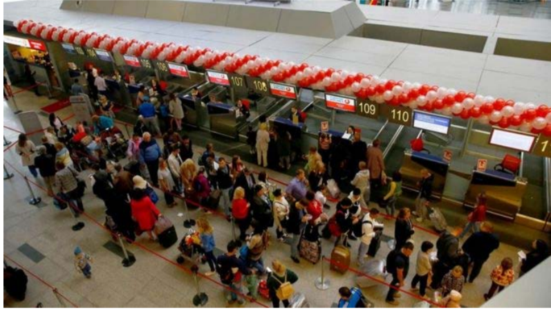
روپرو شده اند. بنا بر این گزارش مأموران فرودگاه هنگام بررسی پاسپورت مسافران ایرانی گزرنامه اکثر آنها را توقیف و آنها را به سالی محصور فرستاده اند و سپس بعد از رفتاری تحقیرآمیز... به صورت تک تک از همه آنها بازجویی کرده اند. به نوشته این گزارش شاهدان و مسافران و متعارف و رفتار توهین آمیز مأموران فرودگاه

گردشگران ایرانی می گویند این رفتار همواره با مسافران ایرانی در فرودگاه مسکو صورت گرفته و می گیرد. همدار به مسافران ایرانی سفارت ایران در مسکو در اطلاعیه ای که روز سه شنبه هشت مرداد منتشر کرده به مسافران ایرانی هشدار داده است که طبق قوانین روسیه، صدور ویزا برای شهروندان دیگر کشورها به معنای ایجاد حق برای آنان جهت ورود به خاک روسیه نیست. از این مسافران خواسته شده که گزرنامه معتبر، روادید معتبر، رزرو هتل به تعداد روزهای روادید و بلیط برگشت به کشور را با خود داشته باشند. در این اطلاعیه همچنین به شهروندان ایرانی توصیه شده از تردد به مناطق شمالی و جنوبی روسیه که شائبه خروج غیرقانونی آنان از مرزهای روسیه وجود دارد، خودداری کنند.