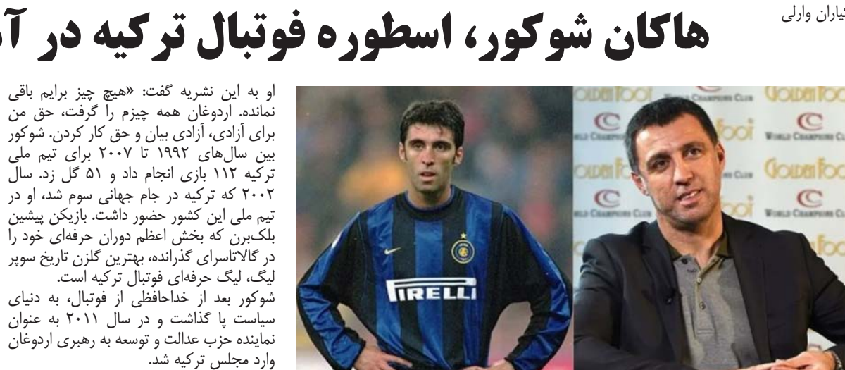
هاکان شوکور بهترین گلزن تاریخ فوتبال ترکیه است که زمانی نامش در کنار بهترین مهاجمان اروپا قرار داشت. او یک اسطوره است. اما حضور مجبور به ترک وطن و مهاجرت به آمریکا شده، جایی که برای گذران زندگی خود را در معرض تهدید به مرگ، اتهامات نادرست و مهاجم پیشین اینتر میلان که حالا ۴۸ ساله شده بی‌پولی قرار داده است.

او به این نشریه گفت: «هیچ چیز برایم باقی نمانده. اردوغان همه چیز را گرفت، حق من برای آزادی، آزادی بیان و حق کار کردن. شوکور بین سال‌های ۱۹۹۲ تا ۲۰۰۷ برای تیم ملی ترکیه ۱۱۲ بازی انجام داد و ۵۱ گل زد. سال ۲۰۰۲ در جام جهانی سوم شد، او در تیم ملی این کشور حضور داشت. بازیکن پیشین بلک‌برن که بخش اعظم دوران حرفه‌ای خود را در کاتالاناسری گذرانده، بهترین گلزن تاریخ سوپر لیگ، لیگ حرفه‌ای فوتبال ترکیه است. شوکور بعد از خداحافظی از فوتبال، به دنیای سیاست پا گذاشت و در سال ۲۰۱۱ به عنوان نماینده حزب عدالت و توسعه به رهبری اردوغان وارد مجلس ترکیه شد. اما او در عین حال به فتح‌الله گولن، واعظ منتقد که آقای اردوغان او را در کودتای خوتین ۲۰۱۶ مقصر دانست هم نزدیک بود. بنا بر گزارش‌ها شوکور که در آن زمان به آمریکا مهاجرت کرده بود، اقدام به کودتا یا محکوم کرد اما با این وجود در ۲۰۱۷، رسانه‌های دولتی ترکیه از او به عنوان «عضو فراری سازمان تروریستی