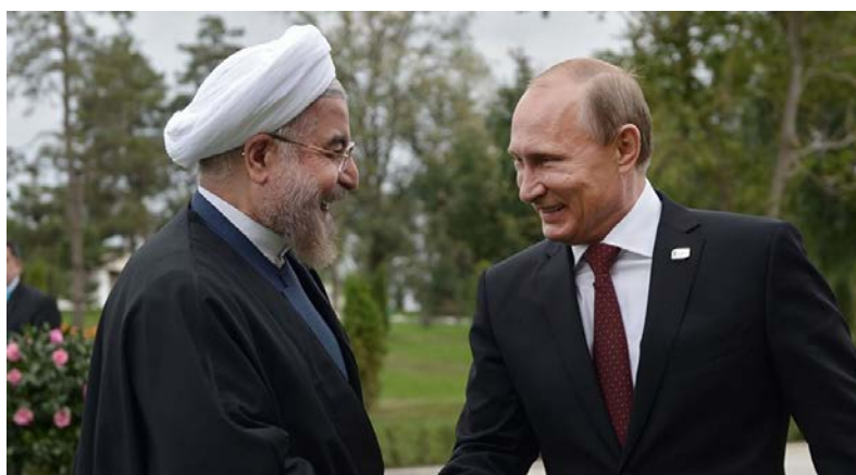
افزایش ۷۰ درصدی تجارت ولادیمیر پوتین، رئیس‌جمهور روسیه نیز گفت که دو کشور برای بیش از ۵۰۰ تارهای کسب کرده‌اند و هدف نهایی هر دو کشور صلح و ثبات در منطقه است.

او اضافه کرد: روابط دوجانبه ما وارد مرحله جدیدی شده است و در این مرحله می‌توانیم درباره روابط پایدار و بلندمدت وارد گفتگو شویم. رئیس‌جمهور ایران درباره این مرحله جدید در روابط کشورش با روسیه توضیح بیشتری داد، ولی ابراز امیدواری کرد که دو طرف بتوانند قدم‌های جدیدی برای گسترش روابط دوجانبه