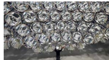
دانشمندان آلمانی با روشن کردن بزرگترین