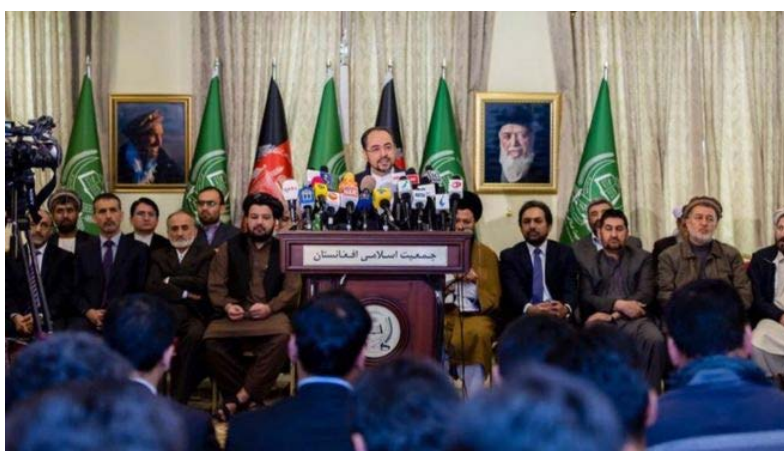
در اصلاحات امور امنیتی و بسیاری دیگر از مقامهای ارشد دولتی حضور داشتند و دفاعی پس از انفجارها اعلام شد که به رئیس اجرائی و وزیر خارجه آسیبی نرسیده است. شاه حسین مرتضوی، سرپرست سنگنوی ارگ ریاست جمهوری در پاسخ به سوال یک خبرنگار درباره اظهارات رئیس حزب جمعیت گفت اجزای سیاسی حق دارند در یک فضای باز ناراستیها را بحث کنند، راه حل‌های سازنده را طرح کنند و خرد جمعی ایجاب می‌کند که با در نظر داشت

به دنبال حملات مرگبار اخیر در کابل، صلاح‌الدین ربانی، رئیس حزب جمعیت و وزیر امور خارجه افغانستان، خواستار برکناری حنیف نهبادهای امنیتی افغانستان شده است. آقای ربانی روز دوشنبه، ۱۵ جوزا/خرداد در یک نشست خبری همچنین گفت افزایش ناامنی در افغانستان نشان‌دهنده ضعف و به وجود آمدن پرسش‌های جدی درباره اراده رهبری نهادهای امنیتی در امر مبارزه با تروریسم است. رئیس حزب جمعیت با اشاره به کشته‌شدن شماری از رهبران و فرماندهان این حزب در ۱۷ سال گذشته، گفت وقتی به ترورهای زنجیره‌ای در سال‌های گذشته و همچنین به انفجارهای انتحاری در مراسم به خاکسپاری در کابل نگاه کنیم می‌توان نتیجه گرفت که موج دوم ترور رهبران توامین آغاز شده است. در مراسم به خاکسپاری سالم ایزدیار، یکی از پنج نفر کشته‌شده در تظاهرات روز شنبه در کابل، عبدالله عبدالله، رئیس اجرائی، صلاح‌الدین ربانی، وزیر خارجه، امرالله صالح، وزیر دولت