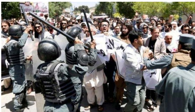
این کشور برای بررسی حمله دیروز در کابل خبر داده است. این جلسه به ریاست محمد اشرف غنی، رئیس جمهوری افغانستان برگزار شده است.

ریاست امنیت ملی افغانستان از بازداشت یک نفر در ارتباط با حمله انتحاری روز گذشته به یک مراسم خاکسپاری در کابل خبر داده است.