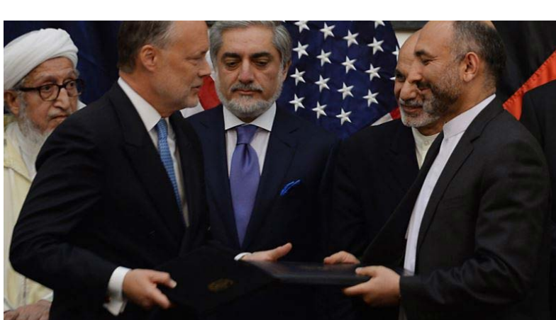
وزیر خارجه افغانستان و سرپرست حزب جمعیت اسلامی و عطا محمد نور، رئیس اجرائی جمعیت با ایبائی تند به کوتاهی دولت در جلوگیری از حوادث خونین ناخندند.

پس از وقوع سه انفجار در مراسم خاکسپاری یکی از کشته‌شدگان تظاهرات روز جمعه کابل که دست کم ۷ کشته و بیش از ۱۰۰ زخمی برجا گذاشت، محمد اشرف غنی، رئیس جمهوری افغانستان گفت می‌پذیرد نهادهای امنیتی این کشور نیاز به اصلاحات اساسی دارد.