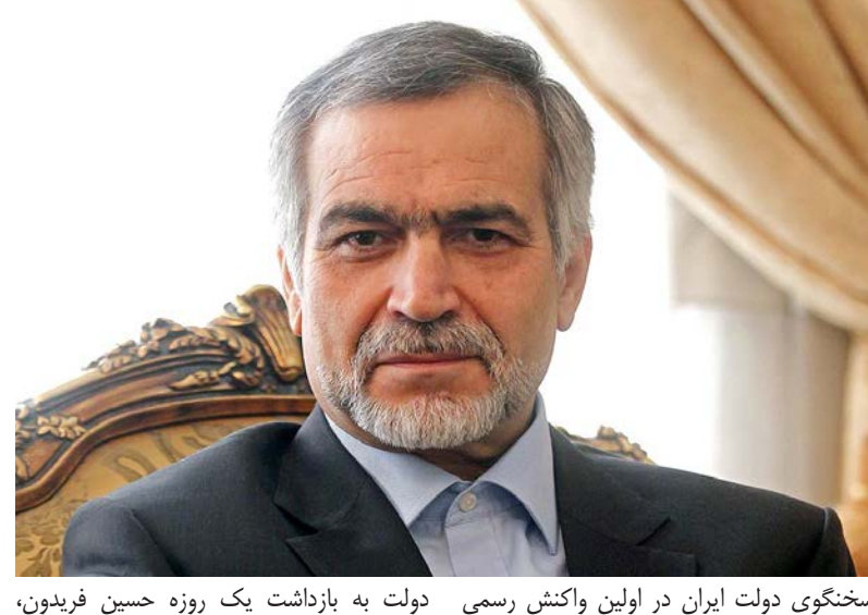
سخنگوی دولت ایران در اولین واکنش رسمی دولت به بازداشت یک روزه حسین فریدون.

می رسید که ظاهرا با توقع دریافت رشوه از بابک زنجانی، از سعید مرتضوی می خواست او را به آقای زنجانی وصل کند و تاکید داشت می تواند برخی مشکلات قضایی را از طریق اخوی حل کند. در بخشی دیگر از نوار، صدای فاضل لاریجانی شنیده می شد که نحوه کمک خود به حل مشکل قضایی یک سرمایه دار دیگر (غیر از بابک زنجانی) را توضیح می داد. سخنگوی دولت امروز همچنین گفته است: این اقدامات (بازداشت حسین فریدون) تأثیری بر اراده روحانی ندارد؛ او بسیار صبور و خوششمار عمل می کند و بسیار زیرک است و می داند برخی اقدامات برای بر من زدن ثبات انجام می شود، اما از اعتدال خارج نمی شود. روحانی بسیار مقاوم است و تسلیم هیچ فشاری نمی شود. دو روز پیش قوه قضائیه اعلام کرد که حسین فریدون به دلیل ناتوانی در تامین قرار وثیقه به زندان منتقل شده است. آقای فریدون دیروز