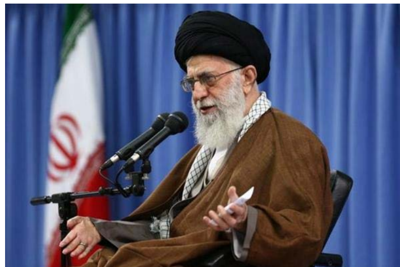
رویه‌نگیا از محل زندگی خود گریخته باشند اکثر آوارگان در شرایط نابسامان انسانی از راه دریا وارد بنگلادش شده اند. رهبر ایران گفته است که این فجایع در مقابل چشم کشورها و دولت های اسلامی و مجامع

آیت‌الله علی خامنه‌ای رهبر جمهوری اسلامی ایران خنوشته‌ها علیه مسلمانان روهینگیا در میانمار را محکوم کرده و ضمن دعوت از کشورهای اسلامی برای فشار به دولت میانمار گفته است که در راس این کشور زنی بی‌رحم قرار دارد. اشاره رهبر ایران به انگ سان سوچی برنده جایزه صلح نوبل است که عملاً رهبری دولت میانمار را در دست دارد.