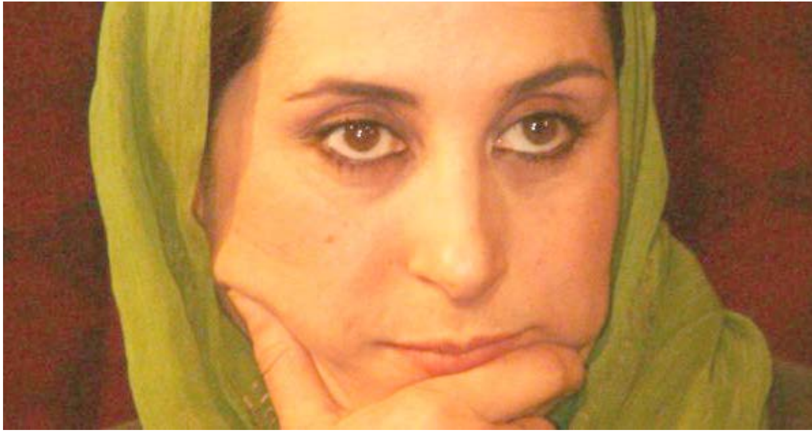
«پریناز» دیده می‌شود خنثی می‌شوم.

«چه غم‌انگیز! واقعا شور و هیجانی ندارید؟»