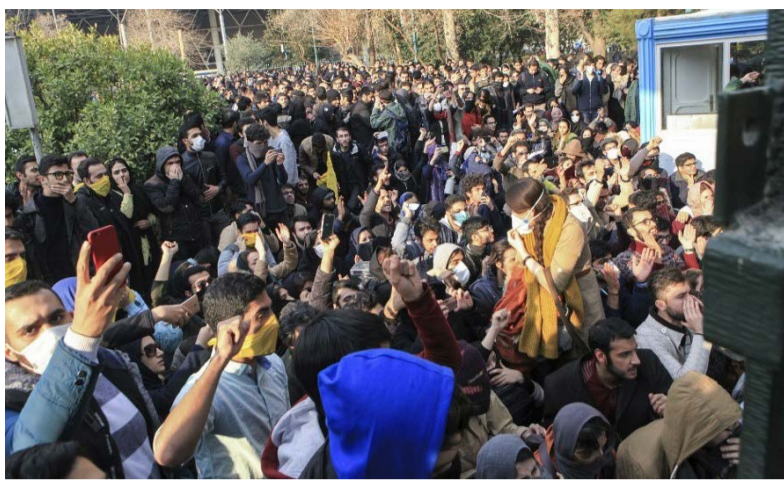
و جانشین فرمانده نیروی انتظامی (پلیس) هم او گفته رفتار و برخورد نیروهای انتظامی و قضایی با بازداشت شدگان حوادث اخیر خوب بوده است. حسن روحانی رئیس جمهور ایران در میانه

عبدالرضا رحمانی فضلی، وزیر کشور ایران برخورد با بازداشتی های وقایع اعتراضی اخیر در ایران را خوب توصیف کرده و گفته است که از هشتاد دستگیر شده، ۳۰۰ متهم اکنون بازداشت هستند. آقای رحمانی فضلی گفته است که پرونده این ۳۰۰ نفر توسط مراجع قضایی در حال رسیدگی است. به گفته وزیر کشور ایران ۹ نفر از این ۳۰۰ بازداشتی در تهران هستند که هیچکدام آنها دانشجوی نیستند. در دی ماه به مدت حدود یک هفته دهها شهر ایران صحنه اعتراضی علیه حکومت بود. در این تظاهرات، که با اعتراض به گرانی در مشهد آغاز شده، بیش از ۲۰ نفر کشته و هزاران نفر بازداشت شدند. مقامهای رسمی مرگ چند شهروند ایرانی در زمان بازداشت را هم تأیید کردهاند. وزیر کشور ایران گفته با تصمیمات مناسب این ناآرامیها توسط شوهرای حامی تأمین مدیریت شد از سوی دیگر مردم هنگامی که متوجه سوء استفاده دشمنان و برخی افراد از این حوادث شدند صف خود را از آنها جدا کردند. آقای رحمانی فضلی به عنوان وزیر کشور و مطابق قوانین ایران، رئیس شورای امنیت کشور