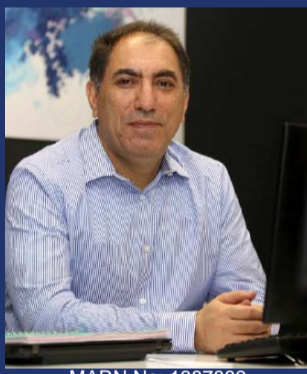
MARN No: 1387882

ترجمه مدارک شما توسط مترجم رسمی استرالیا