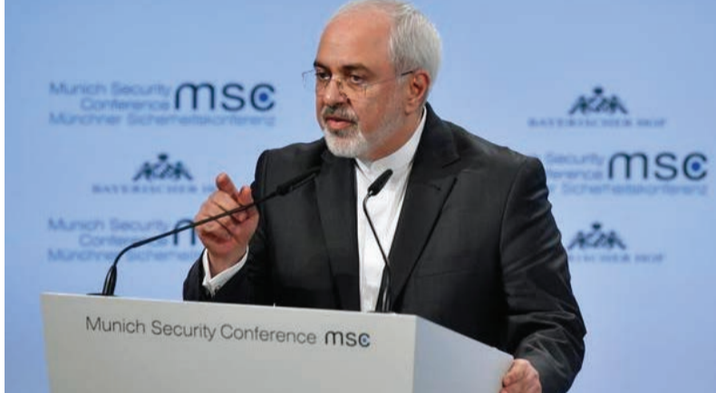
محمد جواد ظریف در کنفرانس امنیتی مونیخ سخنرانی کرد. صحبت وزیر خارجه ایران پس از سخنرانی نخست‌وزیر اسرائیل بود که عمده صحبت‌هایش در باره ایران بود. ظریف در سخنرانی خود به نتانیاها پاسخ داد. محمد جواد ظریف روز یکشنبه (۱۸ فوریه / ۲۹ بهمن) در بخشی از سخنرانی خود در اجلاس امنیتی مونیخ در پاسخ به اظهارات نتانیاها گفت: «امروز ما شاهد یک سیرک مسخره‌ای بودیم که حتی ارزش ندارد به آن پردازیم.»

پهپاد ایرانی سرنگون شده بود، گفت که اسرائیل ایران را بزرگترین خطر برای جهان می‌داند و در صورت لزوم علیه ایران و متحدانش در منطقه اقدام خواهد کرد. ظریف در قسمت دیگری از سخنانش خود به این موضوع هم اشاره کرد که آمریکا و هم‌پیمانان منطقه‌ای این کشور از انتخاب‌های نادرست‌شان در عذاب هستند. او تأکید کرد: «با دست دادن قلمرو خود هنوز خطر داعش و تهدید افراط‌گرایی از بین نرفته است.» وزیر خارجه ایران همچنین تصریح کرد که ایران خواستار یک منطقه قوی است و قصد هژمونی در منطقه را ندارد. او اضافه کرد: «برای ساختن یک منطقه قوی باید واقع بین باشیم و تفاوت‌ها را بپذیریم.»