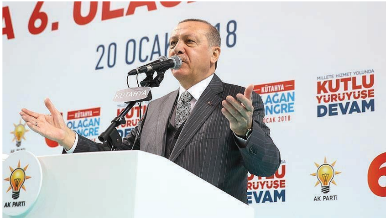
به گفته او بدین ترتیب هر گونه راه کم‌کمرسانی مسدود خواهد شد و این سازمان تروریستی دیگر قادر نخواهد بود با کسی وارد معامله شود. منظور اردوغان از سازمان تروریستی، یگان‌های مدافع خلق است که ترکیه آنها را وابسته به حزب

رجب طیب اردوغان، رئیس‌جمهوری ترکیه، اعلام کرد که محاصره کردهای عفرین توسط ارتش ترکیه آغاز شده است. هنوز مشخص نیست که آیا رژیم سوریه در این منطقه به کمک کردها خواهد آمد یا نه. در نشست حزب عدالت و توسعه در آنکارا، رجب طیب اردوغان، رهبر این حزب و رئیس‌جمهوری ترکیه، اعلام کرد که محاصره شهر عفرین از سوی ارتش ترکیه آغاز شده است. اردوغان در این نشست گفت: «در روزهای آتی و خیلی زود، مرکز شهر عفرین نیز محاصره خواهد شد.»