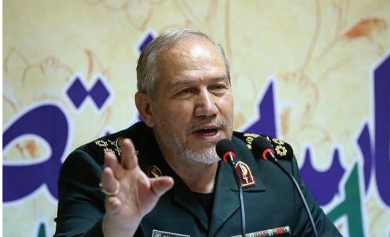
ایران تشکیل شده است. یکی از مقامات لشکر فاطمیون اخیرا از کشته شدن دست‌کم دو هزار

نفر و زخمی شدن هشت هزار افغان دیگر در راه اسلام خبر داده بود. مشاور نظامی رهبر ایران پیش بینی کرد که بازرسی کشور سوریه چند سال طول بکشد و ۳۰۰ تا ۴۰۰ میلیارد دلار هزینه داشته باشد. این در حالیست که در جریان اعتراضات سراسری اخیر در ایران، بسیاری از معترضین در واکنش به وضع بد اقتصادی خطاب به مقامات ارشد حکومت شعار می‌دادند: سوریه را رها کن، فکری به حال ما کن. یحیی رحیم صفوی گفته است: درست است که ما هزینه کردیم اما ایران و روسیه برنده این صحنه هستند. او افزود: روس‌ها قرارداد ۴۹ ساله با سوریه بستند هم‌اکنون نظامی گرفتند و هم اقدام اقتصادی و سیاسی، به نظر ایران هم می‌تواند با دولت سوریه قرارداد طولانی مدت سیاسی و اقتصادی داشته باشد و هزینه‌هایی که کرده است بازگرداند.