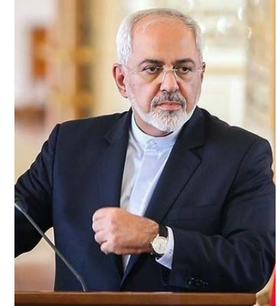
محمدجواد ظریف، وزیر امور خارجه ایران، وارد شدن مذاکرات بر سر مسائل دوجانبه و موضوع موشک‌های بالستیک ایران را اقدامی خطرناک برای حفظ توافق اتمی توصیف و اتحادیه اروپا را تهدید به قطع گفت و گوهای دوجانبه کرده است.

آقای ظریف در گفت و گو با روزنامه اعتماد چاپ تهران که روز ۱۴ اسفند (۵ مارس) منتشر شده گزارش های تأیید نشده از مذاکرات ایران و اروپا بر سر مسائل موشکی ایران را تلویحاً رد کرده و گفته ما برای تشویق اروپا به ایفا کردن نقش سازنده‌تری در منطقه، سال‌هاست با آنها درباره مسائل این منطقه صحبت می‌کنیم اما اگر اروپایی‌ها تمایل داشته باشند این پروسه را با عنوان دیگری در دنیا عرضه کنند ما هم براساس آن تصمیم خواهیم گرفت که آیا این گفت‌وگوها ارزش پیگیری دارد یا خیر.