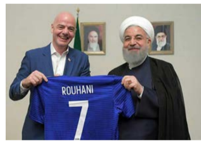
جانی اینفانتینو، رئیس فدراسیون جهانی فوتبال، می گوید حسن روحانی، رئیس جمهور ایران، به او قول داده که با لغو ممنوعیت کنونی، زنان ایرانی به زودی اجازه ورود به ورزشگاهها را پیدا کنند.

آقای اینفانتینو جزئیات این وعده را روشن نکرده است. رئیس فیفا در حالی از وعده مقامهای ایرانی برای ورود زنان به ورزشگاه می گوید که سفری به تهران داشته و با مقامهای ارشد ایرانی، از جمله حسن روحانی، رئیس جمهور و مسعود سلطانی‌فر، وزیر ورزش دیدار کرده است.