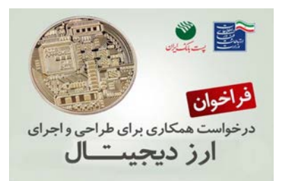
درخواست همکاری برای طراحی و اجرای ارز دیجیتال

عنوان بانک تخصصی حوزه ارتباطات، فراخوانی را برای شناسایی فعالان و نخبگان حوزه ارزهای دیجیتال صادر کرده است. اخیراً محمد جواد آذری جهرمی، وزیر ارتباطات و فناوری اطلاعات کشور از طراحی ارز دیجیتال ملی در ایران خبر داده بود. حالا به نظر می‌رسد این موضوع وارد مرحله جدیدی شده و به صورت جدی‌تری قرار است پیگیری شود. پست بانک ایران به عنوان بانک تخصصی حوزه ارتباطات در کشور، تصمیم دارد برای اجرای سیاست‌های ICT با همکاری فعالان و کلان بخش مالی و