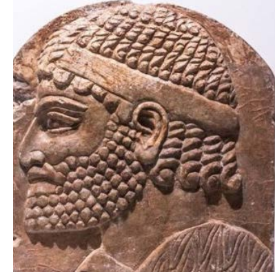
نمایشگاه موزه لوور در تهران روز دوشنبه ۱۴

اسفند (پنج مارس) با حضور ژان ایو لودریان، وزیر امور خارجه فرانسه در محل موزه ملی ایران افتتاح شد. این نمایشگاه به مدت سه ماه برگزار خواهد بود و در آن آثاری از موزه لوور پاریس از جمله تابلوهایی از نقاشان مشهوری مانند رامبراند، مجسمه‌های ایوالهول و آثاری از ایران باستان به نمایش در می‌آید. موزه لوور در سایت خود این نمایشگاه را اولین نمایشگاه بزرگی خوانده که از سوی یک موزه غربی در ایران برگزار می‌شود و آن را رویدادی برجسته از نظر فرهنگی و دیپلماتیک برای هر دو کشور خوانده است. نمایشگاه موزه لوور در تهران - گنجینه مجموعه‌های ملی فرانسه هم‌زمان با هشتادمین سالگرد تأسیس موزه ملی ایران در ساختمان این