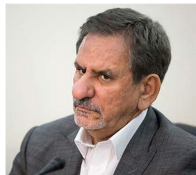
اسحاق جهانگیری معاون اول رئیس جمهور ایران ضمن انتقاد از محمود احمدی نژاد و دفاع از کارنامه دولت حسن روحانی گفته که از مقطعی به او توصیه شده تا سکوت کند اما اگر لازم باشد مجدداً لب به انتقاد خواهد گشود.

آقای جهانگیری روز ۱۵ اسفند (ششم مارس) گفته من راجع به دوره بد کشور خیلی صحبت کرده‌ام، از مقطعی به من توصیه به سکوت کردند و من هم گفتم چشم، ولی الان سر تا ذیل