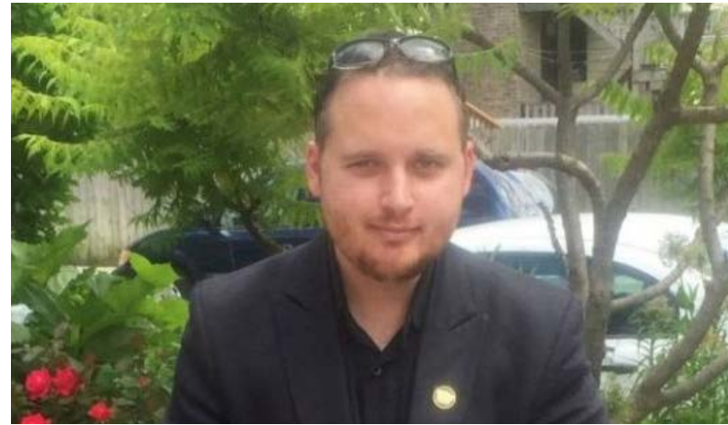
آدریان لامو در هک مایکروسافت و نیویورک تایمز در زمان فعالیتش به عنوان هکر دست

آدریان لامو، هکری که با انتقال اطلاعات باعث بازداشت جلسی میننگ، افشاگر اسرار دولت آمریکا شد، در ۲۷ سالگی درگذشته است. جلسی میننگ در طول مکالمات اینترنتی خود به آدریان لامو اطمینان کرد و به او گفت که اطلاعات سری نظامی را به ویکی‌لیکس فرستاده است. آدریان لامو این موضوع را به مقامات خبر داد و باعث بازداشت میننگ شد. دلیل مرگ آدریان لامو هنوز اعلام نشده است. جولین آسائز، موسس ویکی‌لیکس در واکنش، آدریان لامو را شهادی خردپا خوانده است. در میان اطلاعات محرمانه‌ای که جلسی میننگ به سایت افشاگر ویکی‌لیکس تحویل داد، قطعه فیلمی حاوی تصاویر کشته شدن ۷ نفر از جمله خبرنگار خبرگزاری رویترز در طی حمله یکی از هلی کوپترهای آپاچی ارتش آمریکا در عراق بود. ماریو، پدر آدریان لامو خبر فوت پسرش را در فیسبوک اعلام کرد. آدریان لامو در هک مایکروسافت و نیویورک تایمز در زمان فعالیتش به عنوان هکر دست