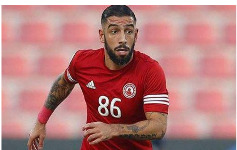
دژاگه با بیان این که در این مصداق هم چون یک شوک برای من بود، افزود: با این حال الان می‌توانم قوی برگردم.