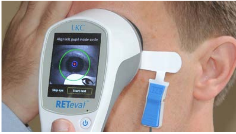
دستگاه RETeval قرار گرفت و یک چشم خود را بست و ۱۰ تا ۲۰ اشعه سفید و رنگی با استفاده شده است. در این بررسی هر بیمار مقابل

محققان آمریکایی با بررسی ۵۰ بیمار دریافتند که یک دستگاه بررسی شبکه چشم قادر است وجود بیماری اسکیزوفرنی را تشخیص دهد. به نقل از گیزمگ، پزشکان برای تشخیص بیماری اسکیزوفرنی مجبورند که علائم گزارش شده بیمار را مشاهده و بررسی کنند که این تشخیص بنا بر نظر هر پزشک، متفاوت خواهد بود. بر اساس مطالعات جدید، ابزار بی‌بی‌بی‌ستجی پزشکان نیز ممکن است این بیماری را سریع‌تر و کاربردی‌تر تشخیص دهد.