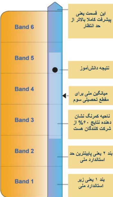
شکل ۲- پیشرفت نموداری نپلن در مقطع تحصیلی سوم

۲- میانگین کل دانش آموزان شرکت کننده در آزمون خاص و مقطع تحصیلی خاص ۳- جایگاه دانش آموز در بین تمام شرکت کنندگان در آزمون خاص و مقطع تحصیلی خاص ۴- حد فاصل بندهای پیشرفت که ۶۰٪ تمام دانش آموزان شرکت کننده در آن قرار دارند بنابراین با استفاده از این ویژگیها به راحتی میتوان به وضعیت دانش آموز در مقایسه با بقیه شرکت کنندگان در آزمون پی برد. همانطور که در بالا ذکر شد این نتایج به معنای قبولی یا ردی نیست و در صورت نگرانی، دانش آموزان یا والدین میتوانند با معلمان مربوطه و یا کارشناسان آموزشی مشورت نمایند.