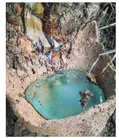
سقز یا کندر از جمله مفید ترین گیاهان دارویی است که مصرف آن فواید بسیاری را برای سلامت فرد به دنبال دارد.

درخت سقز از تیره پسته ایان بوده با ارتفاع ۲ تا ۷ متر که گاهی به ۹ متر هم می رسد و معمولاً در کوهستان های با آب و هوایی نه چندان سرد می روید. عمر درخت سقز طولانی بوده در بعضی مناطق ایران درختهایی با عمر ۱۵۰۰ سال یافت می شود و در حال حاضر جزو لیست درختان