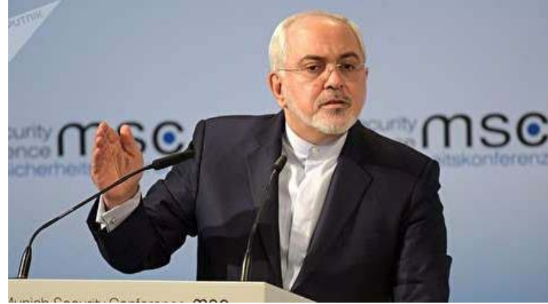
وزیر امور خارجه ایران داده است. آقای خامنه‌ای در سخنرانی اخیر خود به صراحت مذاکره با آمریکا را رد کرد و گفت در شرایط فعلی چنین کاری را ممنوع می‌کند. دونالد ترامپ، بعد از اعلام خروج

محمد جواد ظریف، وزیر امور خارجه ایران می‌گوید که درباره آمریکایی‌ها و رویکردشان به توافق هسته‌ای و تحریم ایران اشتباه کرده است. آقای ظریف در گفت‌وگو با سی‌ان‌ان بار دیگر آمریکا را دچار اعتیاد به تحریم خوانده و گفته است که تصور می‌کرده که آمریکا یاد گرفته که در مورد ایران، تحریم‌ها دشواری‌های اقتصادی ایجاد می‌کند اما نتایج سیاسی را که آن‌ها هدف گرفته‌اند به دنبال ندارد. وزیر امور خارجه ایران اذعان کرده است که متأسفانه در این زمینه اشتباه می‌کردم. آقای ظریف در اولین گفت‌وگوی خود با یک رسانه خارجی بعد از اعلام خروج آمریکا از برجام احتمال مذاکره با دولت دونالد ترامپ، رئیس‌جمهور آمریکا در آینده را رد کرده اما ابراز امیدواری کرده که توافق هسته‌ای همچنان حفظ شود.