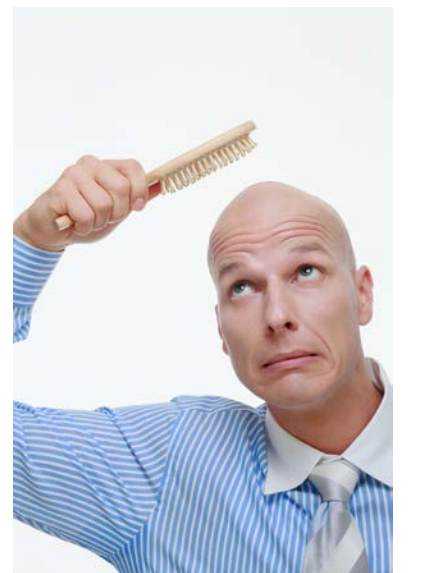
شاید برخی از مردان از دو جهت بدشانسی آورده باشند، چرا یک پژوهش جدید نشان می‌دهد

رابطه‌های ژنتیکی میان قد کوتاه و طاسی زودرس وجود دارد. به گزارش هلندی گروهی از دانشمندان آلمانی به سرپرستی دکتر استفانی هیلمن - همیخ از بخش ژنتیک انسانی دانشگاه بن توانستند ۶۳ تغییر در ژنوم انسانی را پیدا کنند که احتمال ریزش موی زودرس در مردان را افزایش می‌دهند. هیلمن - همیخ در این باره گفت: «معلوم شد که برخی از این تغییرات ژنتیکی با سایر خصوصیات بدنی و بیماری‌ها از جمله قد کوتاه ارتباط دارند.» این پژوهشگران ژن‌های ۱۱۰۰۰ مرد مبتلا به طاسی زودرس و ۱۲۰۰ مرد بدون طاسی را آنالیز کردند. یافته‌های این پژوهشگران همچنین تأییدکننده یافته‌های پیشین در این باره بود که طاسی