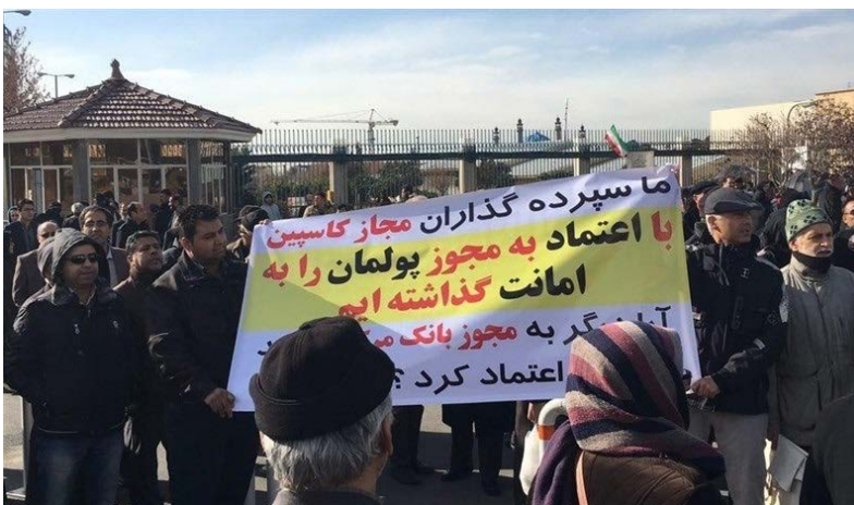
و سایر دستگاهها بیندازد بلکه باید خودش به میدان می‌رفت و مانع از بروز چنین وضعیتی شد.