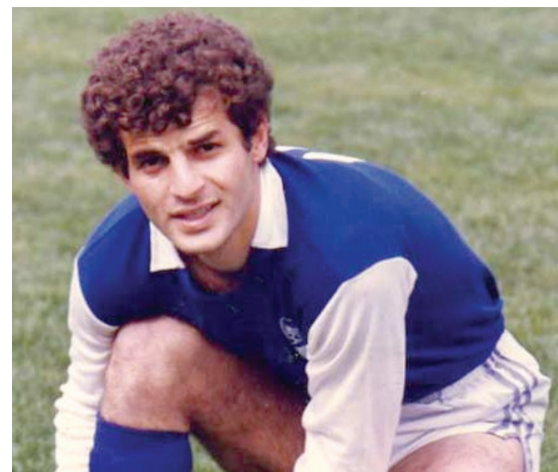
رضا احدی، کاپیتان سابق تیم فوتبال استقلال تهران و بازیکن سابق تیم ملی ایران، روز صبح دوشنبه ۲۸ دی در بیمارستانی در تهران درگذشت. آقای احدی که ۵۳ سال داشت به علت عفونت داخلی و نارسایی کبد درگذشت. او پیش از درگذشت، چند روز در کما بود.

روز گذشته برادر او گفته بود که پزشکان نتوانستند آقای احدی را دنبال کنند. به گزارش خبرنگاری دانشجویان ایران، ایستاد، رضا احدی روز پانزدهم دی ماه به دلیل آنچه خود، مشکل اعصاب عنوان می کرد در بیمارستان بستری شد، ولی سپس پزشکان عفونت داخلی و عارضه کبد را در بدن وی تشخیص دادند. رضا احدی سال ۱۳۴۱ در تهران به دنیا آمد. کمتر از ۱۸ سال داشت که به تیم استقلال تهران پیوست و مدت هفت سال در پست هافبک چپ برای این تیم بازی کرد. سپس به آلمان رفت و در تیم روت وایس اسن بازی کرد. او و حمید علیدوستی نخستین بازیکنان ایرانی بودند که پس انقلاب ایران در آلمان مشغول بازی شدند. او مدت کوتاهی بین سالهای ۱۳۶۱ تا ۱۳۶۳ نیز عضو تیم ملی ایران بود و ۱۳ بار برای تیم ایران بازی کرد. سالهای اوج فوتبال او و عضویتش در تیم ملی همزمان بود با بحران در تیم ملی ایران و عدم حضور فאלانه این تیم در عرصه های بین المللی. احدی در سال ۱۳۶۷ به ایران بازگشت و بار دیگر پیراهن استقلال را پوشید. آخرین سال بازی او در این تیم همزمان شد با قهرمانی استقلال در باشگاه های آسیا. احدی سال ها پس از کنار گذاشتن فوتبال حرفه ای به عنوان بازیکن، به عنوان مربی هدایت تیمهایی چون استقلال اهواز، ابومسلم