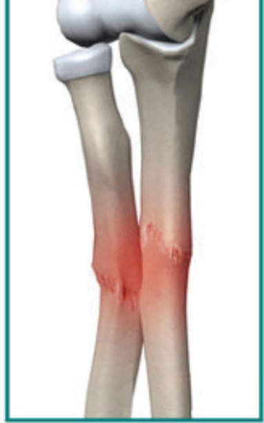
عفونت های نوع استئومیلیت

آزمایشات مکمل * رادیوگرافی: برای دیدن ترک خوردگی باید دانست که در ۵۰ درصد شکستگی‌ها رادیوگرافی چیزی نشان نمی‌دهد و علائم کلینیکی زودتر از عکسبرداری خودشان را نشان می‌دهند.