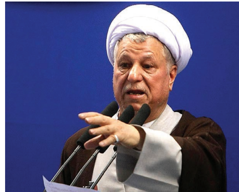
اکبر هاشمی رفسنجانی، رئیس مجمع تشخیص مصلحت نظام و عضو مجلس خبرگان روند تأیید صلاحیت‌های داوطلبان نامزدی در انتخابات

او گفت: اینکه ۱۲ نفر در شورای نگهبان طرف چند روز صلاحیت ۱۲ هزار نفر را برای دو کار بسیار مهم یعنی مجلس خبرگان رهبری و مجلس شورای اسلامی بررسی کرده اند و نظر داده اند، برای اکثریت جامعه قانع کننده نبود و دیدیم که چگونه به این اقدام عکس العمل نشان دادند. آقای هاشمی رفسنجانی بار دیگر در واکنش به عدم احراز صلاحیت حسن خمینی، نوه بنیانگذار جمهوری اسلامی او را عالمی فرزانه و شخصیتی قابل احترام برشمرد که پس از اینکه صلاحیتش تأیید نشد، بعضی از جریان‌ها برای سوء استفاده های سیاسی در صدد ایجاد موج منفی علیه او بوده اند.