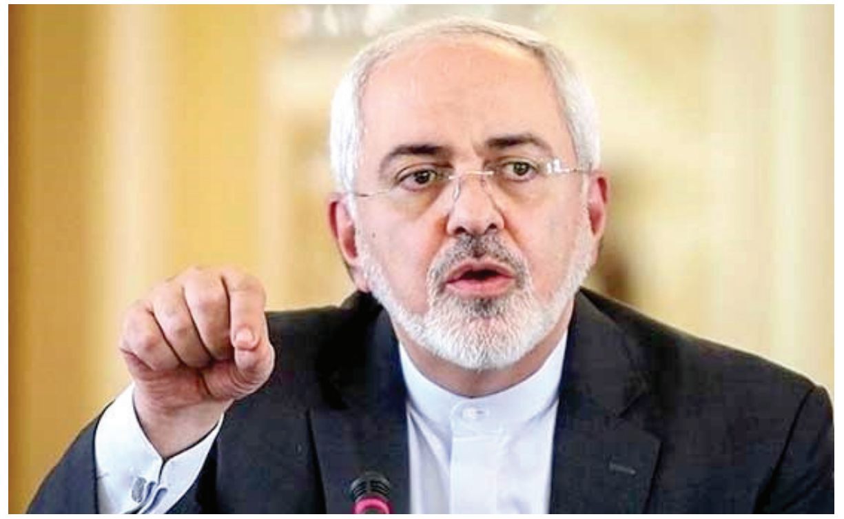
محمدجواد ظریف، وزیر امور خارجه ایران گفته است که کشورش دولت آمریکا را مسئول حفظ اموال خود می داند و اگر به دارایی های ایران دست اندازی شود، ادعای خسارت خواهد کرد. آقای ظریف روز ۶ اردیبهشت (۲۵ آوریل) در یک کنفرانس خبری مشترک با وزیر امور خارجه

باراک اوباما رئیس جمهور آمریکا که در آلمان به سر می برد قرار است خبر اعزام ۲۵۰ خدمه نظامی دیگر به سوریه برای حمایت از شبه نظامیان محلی در نبرد با گروه موسوم به دولت اسلامی (داعش) را اعلام کند. مقام های آمریکایی می گویند که هدف از این کار تشویق کشورهای عرب سنی به پیوستن به نیروهای کرد در شمال شرقی سوریه است. استقرار تازه شمار خدمه نظامی آمریکا در نقش غیررسمی در سوریه را به ۳۰۰ نفر می رساند. آقای اوباما پیشتر در مصاحبه با بی بی سی اعزام نیروی زمینی به سوریه را رد کرده بود. او گفت که وضعیت دلخراش سوریه که بسیار بیخبر است فقط با تکیه بر نیروی نظامی قابل حل نیست. خبرگزاری آسوشیتدپرس گزارش می دهد که بیشتر نیروهای اضافی که به سوریه اعزام خواهند شد کماندو خواهند بود، اما این نیرو شامل خدمه پزشکی و لجستیکی هم خواهد بود. این خبر را قرار است آقای اوباما رسماً روز