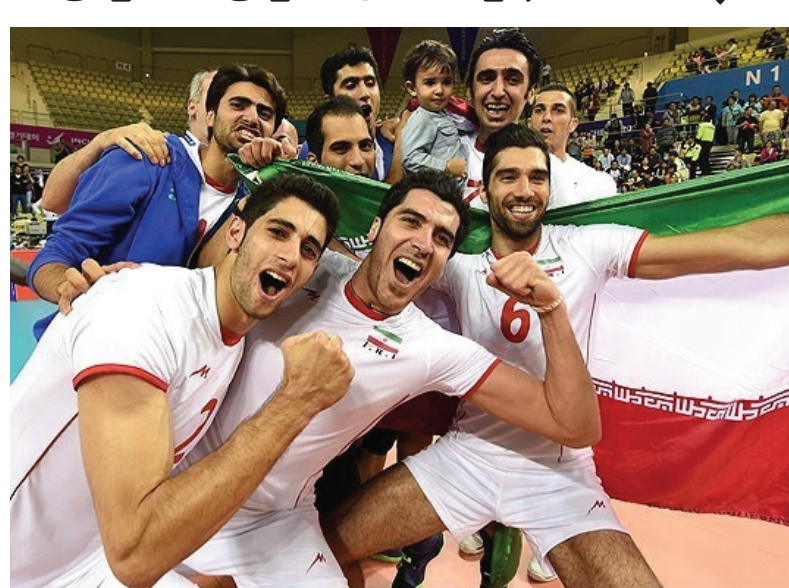
چهارم را ایران توانایی آغاز کرد و توانست برتری خود را تا پایان ست حفظ کند و ۲۵-۱۸ برنده

در ست اول ایران با نتیجه ۲۵-۲۳ پیروز شد و در ست دوم و سوم ۲۷-۲۹ و ۲۱-۲۵ باخت، ست