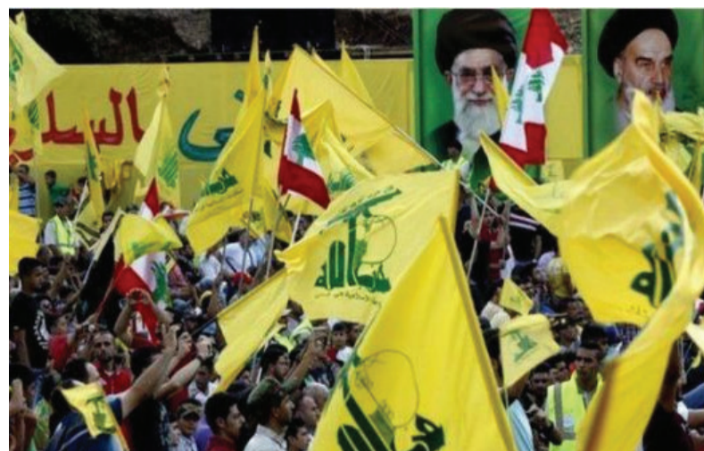
مترجمان غربی و عربی این رژیم به اندازه کافی به مجامع بین المللی و منطقه ای و در مصاحبه های مطبوعاتی خود همواره بر حمایت جمهوری اسلامی از حماس و پافشاری کرده اند. او افزود که این کشورها بیش از این نمی توانند

در پی اظهارات رهبر گروه حزب الله دایر بر اینکه ایران همه نیازهای مالی این گروه را تامین می کند، یک سخنگوی سپاه پاسداران ایران گفته که نباید نگران عواقب اعلام علنی حمایت ایران از این گروه بود. گروه شبه نظامی شیعه حزب الله لبنان متهم به انجام بمبگذاری ها و حملات دیگری علیه یهودیان و اسرائیل است و از سوی کشورهای غربی، اسرائیل و اعضای اتحادیه عرب یک سازمان تروریستی تلقی می شود. شیخ حسن نصرالله، رهبر حزب الله لبنان، دو روز پیشتر در یک سخنرانی عمومی با اشاره به محدودیت های اخیر مالی علیه این گروه گفت که این محدودیت ها تأثیری در وضعیت حزب الله ندارد چون تمام منابع مالی حزب الله نه از بانک ها بلکه از سوی ایران تامین می شود. به گزارش خبرگزاری دانشجویان ایران، ایسنا، سردار رمضان شریف مسئول روابط عمومی سپاه پاسداران ایران گفت که ایران از قبل به خاطر حمایت از حزب الله شاهد فشارهایی بوده بنابراین بعید است این فاش گویی عواقب تازه دیگری برای ایران داشته باشد. او گفت: رژیم صهیونیستی اشاره به اسرائیل و