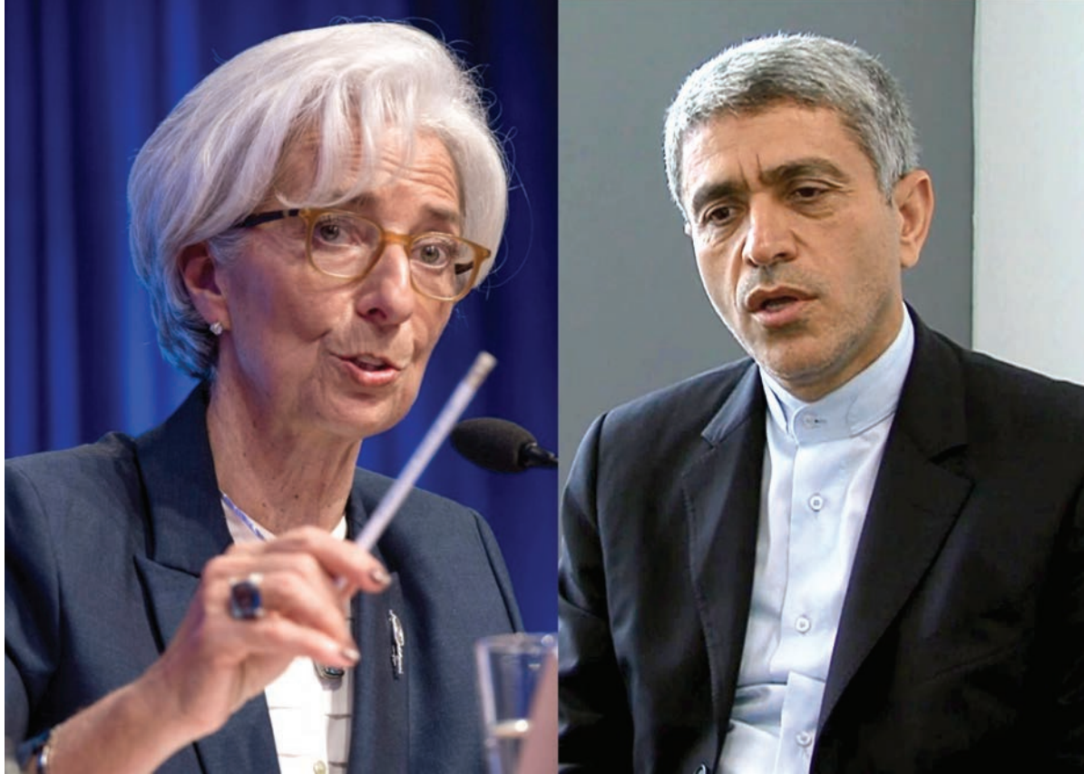
واشنگتن به سر می برد. در زمان حضور وزیر اقتصاد ایران در واشنگتن، وزارت خزانه داری آمریکا هم دستور العمل تازه ای در مورد معاملات