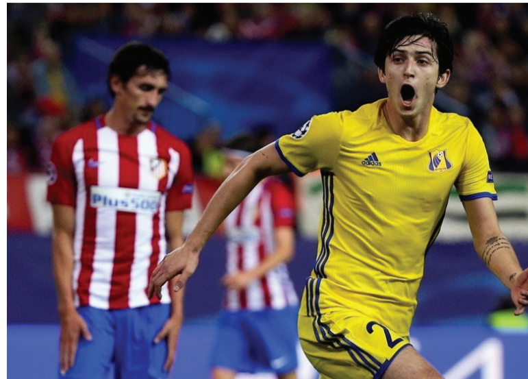
بعد از او اندرانیک تیموریان برای بوتون در لیگ برتر بازی کرد و در ادامه اشکان دژاگه نیز حضور خوبی برای فولام در لیگ برتر داشت و نفر سوم تیم لندن بود.

در حال حاضر سران باشگاه لیورپول در حال بررسی این انتقال هستند و بعد از زیر نظر گرفتن سرارد در بازی های قبلی، در حال حاضر مقدمات برای ارائه پیشنهاد رسمی به باشگاه روستوف در حال انجام است. آزمون بازیکنی نیست که بلافاصله بعد از جذب از سوی تیم، تبدیل به فوق ستاره آن شود و چیز جدیدی برای لیورپول فراهم کند. او نیاز به پیشرفت دارد تا در آینده به بازیکن مهمی برای تیمش تبدیل شود. درست شبیه مارکو کروئیک که ژانویه سال گذشته به لیورپول پیوست و این باشگاه نیز او را به چند تیم قرض داده تا پیشرفت کند. سرارد از آزمون عنوان کرده است که تاکنون هیچ پیشنهاد رسمی از تیم هایی چون آژاکس، ماریس یا لیورپول دریافت نکرده و در صورت دریافت هر گونه پیشنهاد از این تیم ها، آن را بررسی خواهد کرد.