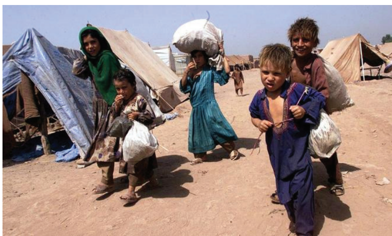
نیازهای جهانی به کمکهای انساندوستانه است که از جنگ جهانی دوم بی سابقه بوده است. حدود ۱۲۸ میلیون نفر در جهان برای زندگی نگران کننده سقوط کرده است.

سازمان ملل متحد برای مقابله با بحران انسانی در سال آینده میلادی (۲۰۱۷) از افراد و نهادهای خیر تقاضای کمک بیست و دو میلیارد دلاری کرده است. این سازمان در گزارشی گفته که میلیون‌ها نفر در مناطق جنگ زده جهان نظیر سوریه و یمن زندگی می‌کنند که دسترسی به آنها سخت است چون کارمندان سازمان ملل نمی‌توانند به این مناطق وارد شوند. گزارش اخیر سازمان ملل دسترسی به مناطقی مانند سوریه، یمن، عراق و سودان جنوبی را بسیار محدود توصیف کرده است، مناطقی که بگفته این سازمان ساکنان آنها از خدمات اولیه زندگی محرومند. از جمله عواملی برشمرده شده که زندگی بسیاری دیگر از مردم آسیب پذیر جهان را به مخاطره انداخته است، استفان اوبرین، مدیر کمک‌های انساندوستانه سازمان ملل گفته است: این حجم درخواست منعکس کننده وضعیت