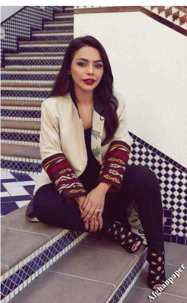
میراث سنگین پدر

برهان‌الدین ربانی، پدر فاطمه، در دست کم ۴۰ سال گذشته، یکی از چهره‌های شناخته شده و مطرح در صحنه سیاسی افغانستان بود. ریاست جمهوری او در اوایل دهه ۹۰ میلادی، همراه و بیجا شدن شمار زیادی از افغان‌ها شد. او در سپتامبر سال ۲۰۱۱، زمانی که رئیس شورای عالی صلح افغانستان بود، به دست گروه طالبان کشته شد.