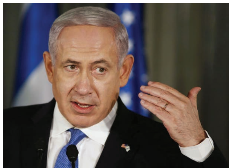
گفتگو خواهد کرد. آقای نتانیا هو در پاسخ به خانم استال گفته برخلاف دیگران او تصور می‌کند که

امضای برجام راه را برای رسیدن ایران به سلاح اتمی هموار کرده است چرا که پیش از برجام تهران از تحریم‌ها و اقدامات غرب در برابر تلاش برای پیشبرد برنامه های هسته‌ای‌اش می‌هراسید. دونالد ترامپ، رئیس‌جمهوری منتخب آمریکا که تا چهل روز دیگر وارد کاخ سفید خواهد شد، در جریان کارزارهای انتخاباتی خود بارها توافق هسته‌ای میان تهران و گروه ۵+۱ را اشتباه، احق‌قانه و افتضاح خوانده اما ژنرال جیمز متیس، فردی که آقای ترامپ به عنوان وزیر دفاع خود برگزیده در مورد عواقب بیرون رفتن واشنگتن از این توافقنامه که امضای پنج قدرت جهانی دیگر هم در پای آن وجود دارد، با ملاحظه سخن گفته است. با وجود ابراز خرسندی و خوشبینی آقای نتانیا هو نسبت به حمایت از برجام، رئیس‌جمهوری آمریکا بر سر مسأله ایران، موضوعی شخصی نبوده و او همواره برای آقای اوباما احترام قائل بوده و هست. نخست‌وزیر اسرائیل در این گفتگوی تلویزیونی (یکشنبه ۱۱ دسامبر - ۲۱ آذر) تأکید کرده در دیدار آتی خود با دونالد ترامپ در مورد راه‌هایی که به نظر او برای لغو کردن برجام وجود دارد