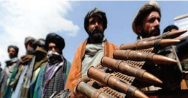
او هشدار داد که اگر در این فصل سرما به این آوارگان کمک نرسد، یک فاجعه انسانی آن‌ها را تهدید خواهد کرد. این مقام محلی دولتی گفت که نیروهای دولتی در حالی از این منطقه عقب‌نشینی کردند که از چند روز پیش عملیات زمینی و هوایی علیه طالبان ادامه داشت، اما این