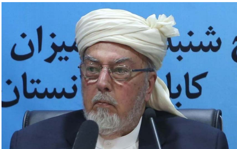
پیر سید احمد گیلانی، رئیس شورای عالی صلح افغانستان ساعتی پیش در شفاخانه‌ای در کابل به سن ۸۵ سالگی درگذشت.

پیر سید احمد گیلانی، رئیس شورای عالی صلح افغانستان ساعتی پیش در شفاخانه‌ای در کابل به سن ۸۵ سالگی درگذشت. عطاالله رحمان سلیم، معاون شورای عالی صلح در صحبتی با بی‌بی‌سی این خبر را تأیید کرد. آقای سلیم گفت که پیر گیلانی سه روز پیش به‌دنبال حمله قلبی در شفاخانه غازی امان‌الله خان ( شفاخانه اداره امنیت) در کابل بستری شده بود. پیر سید احمد گیلانی، از رهبران جهادی افغانستان بود که رهبری حزب محاذ ملی را نیز برعهده داشت. ارگ ریاست جمهوری افغانستان نیز با انتشار خبرنامه‌ای، درگذشت آقای گیلانی را ضایعه بزرگ برای افغانستان خوانده و نقش او را در موفقیت مذاکرات بین‌المللی صلح با حزب اسلامی گلبدین حکمتیار یاد کرده است. آقای گیلانی در فوریه سال ۲۰۱۶ به عنوان رئیس شورای عالی صلح افغانستان معرفی شد. سید احمد گیلانی متولد ۱۹۳۲ در ولسوالی سرخورد ولایت شرقی ننگرهار بود و نسبتش به عبدالقادر گیلانی بنیانگذار طریقت قادریه می‌رسد. آقای گیلانی تحصیلات متوسطه را در