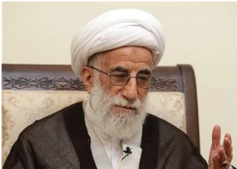
نمودی‌ها و زمزمه شورای رهبری احمد جنتی درباره راه پیدا کردن «نفوذی‌ها» به مجلس خبرگان هم هشدار داده و گفته است

احمد جنتی، دبیر شورای نگهبان ایران می‌گوید پرونده تعدادی از داوطلبان انتخابات خبرگان رهبری نشان می‌دهد که این افراد قمارباز و مشروب خوارند و برخی دیگر مشکلات اخلاقی دارند. به گزارش خبرگزاری ایسنا آقای جنتی بار دیگر از تعداد بالای ثبت نام کنندگان در انتخابات خبرگان و مجلس انتقاد کرد و گفت در میان داوطلبان مجلس خبرگان برخی کت و سلواری و برخی نیز زن هستند که مراجعه و ثبت نام کرده‌اند. من نمی‌فهمم که وضعیت چگونه است و چرا اینقدر بی در و پیکر است. ۸۰ نفر برای نامزدی در این دوره از انتخابات خبرگان ثبت نام کرده‌اند که نسبت به دوره قبل در سال ۱۳۸۵، بیش از ۶۰ درصد افزایش یافته است. ده نفر از حدود ۵۰۰ نفری که برای شرکت در آزمون کتبی خبرگان دعوت شده‌اند داوطلبان زن هستند. این آزمون، فردا سه‌شنبه ۱۵ دی ماه برگزار می‌شود. انتخابات مجلس خبرگان رهبری و مجلس شورای اسلامی هم‌زمان روز هفتم اسفندماه برگزار می‌شود و صلاحیت داوطلبان هر دو انتخابات باید به تایید شورای نگهبان به ریاست آقای جنتی برسد.