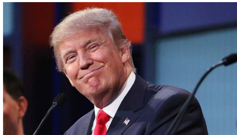
دونالد ترامپ، رئیس جمهوری منتخب آمریکا گفته تصمیم بریتانیا برای خروج از اتحادیه اروپا هوشمندانه بوده و اوضاع این کشور بعد از برگزیت خیلی بهتر هم شده و در نهایت بریتانیا از این تصمیم بهره خواهد برد.

دونالد ترامپ، رئیس جمهوری منتخب آمریکا گفته تصمیم بریتانیا برای خروج از اتحادیه اروپا هوشمندانه بوده و اوضاع این کشور بعد از برگزیت خیلی بهتر هم شده و در نهایت بریتانیا از این تصمیم بهره خواهد برد. ترامپ در سخنرانی خود با یک نشریه بریتانیایی به تحلیلگر روزنامه تایمز گفته از نظر او اوضاع بریتانیا بعد از تصمیم به خروج از اتحادیه اروپا همین الان هم خیلی خوب است. رئیس جمهوری منتخب آمریکا که تا ۵ روز دیگر وارد کاخ سفید می شود در این گفتگو با مایکل گانو، از دولتمردان سابق بریتانیا مصاحبه کرده و به او که خود یکی از حامیان بزرگ خروج بریتانیا از اتحادیه اروپا بود گفته برخلاف نظر باراک اوباما، او تلاش خواهد کرد روابط تجاری میان لندن و واشنگتن را بهتر از پیش کند. این گفته آقای ترامپ واکنشی به سخنان آقای اوباما پیش از همه پرسیم معروف به برگزیت است که گفته بود اگر بریتانیا از اتحادیه اروپا خارج شود، آن گاه این کشور در انتهای صف روابط تجاری با آمریکا قرار خواهد گرفت. آقای ترامپ در این گفتگو وعده داده که به محض به قدرت رسیدن، یک توافق تجاری با بریتانیا برای تسهیل روابط اقتصادی میان دو کشور صورت دهد. او گفته: کشورها می خواهند هویت خودشان را حفظ کنند. بریتانیا هم تصمیم گرفته هویتش را نگه دارد. اما به نظر من اگر بریتانیا مجبور نمی شد آن همه مهاجر بپذیرد آن وقت شاید برگزیت اصلا روی نمی داد. رئیس جمهوری منتخب آمریکا همچنین در گفتگو با روزنامه آلمانی بیلد از سیاست های