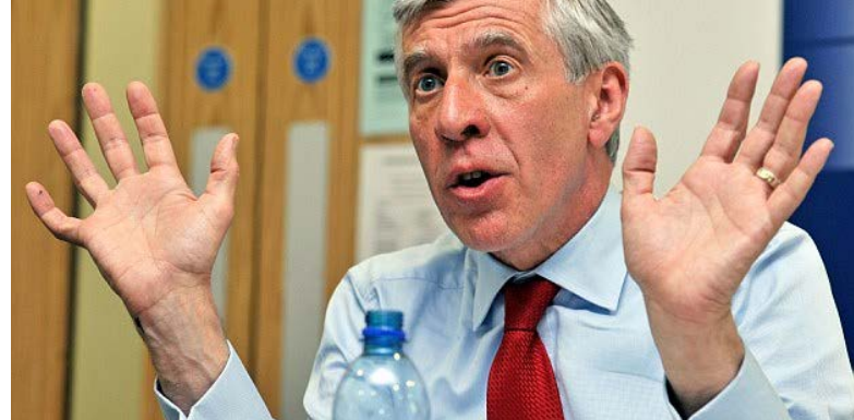
میکل گو، وزیر امور خارجه سابق بریتانیا، در واکنش به اظهارات دونالد ترامپ، رئیس جمهور منتخب آمریکا، نسبت به سیاست های مهاجرتی آلمان گفت که در وهله اول این مداخله آمریکا در امور خاورمیانه و عدم مدیریت صحیح آن بود که موجب بروز بحران پناهندگی شد.

دیوان عالی بریتانیا حکم داده است که یک فعال سیاسی مخالف معمر قذافی، دیکتاتور سابق لیبی، می تواند از جک استرا، وزیر خارجه سابق بریتانیا، در دادگاه های بریتانیا شکایت کند. عبدالحکیم بلجاج می گوید سازمان اطلاعات خارجی بریتانیا (MI6) او را به رژیم قذافی لو داد و همین منجر به ربوده شدن آقای بلجاج و شکنجه او در لیبی شد. دولت بریتانیا در پی آن بود که مانع از طرح شکایت آقای بلجاج شود، اما با حکم امروز دیوان عالی ممکن است وزیر خارجه سابق بریتانیا ناچار باشد به اتهام های مطرح شده پاسخ بدهد. آقای بلجاج، که قبلا در گروه های شورشی بوده و اکنون در لیبی فعالیت سیاسی می کند، گفته که حاضر است در صورت عذرخواهی دستگاه اطلاعاتی بریتانیا و دریافت یک میلیون پوند خسارت از شکایت خود صرف نظر کند. عبدالحکیم بلجاج از لیبی به چین گریخته بود و قصد داشت به همراه همسرش، که در آن زمان حامله بود، به بریتانیا پناهنده شود. اما او «برنده