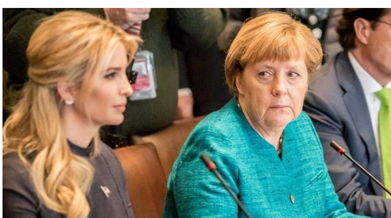
ایوانکا ترامپ و آنجلسا مِرکل، صدراعظم آلمان، در اجلاس زنان G20 روز سه‌شنبه به برلین می‌آیند. این اجلاس در آستانه نشست اصلی G20 (در ماه ژوئیه) برگزار می‌شود. هم‌چنین از سفر آنجلسا مِرکل صدراعظم آلمان به واشنگتن در ۶ هفته پیش آغاز شد؛ یعنی زمانی که در یک میزگرد با شرکت رئیس‌جمهور آمریکا و نمایندگان اقتصادی این کشور، جای نشستن شرکت‌کنندگان طوری پیش‌بینی و ترتیب داده شده بود که آنجلسا مِرکل کنار ایوانکا ترامپ بنشیند.

معاون سخنگوی دولت آلمان پس از این نشست چندچون فضایی میان مِرکل و ایوانکا را یک موقعیت دلپذیر برای گفتگو توصیف کرد و در همین جا بود که صدراعظم آلمان دختر ترامپ را برای شرکت در نشست زنان G20 به برلین دعوت کرد. آلمان امسال میزبان نشست G20 در ماه