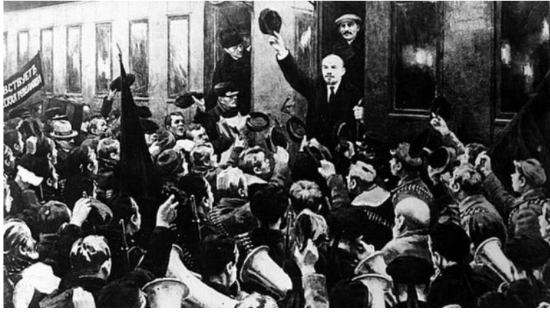
ولادیمیر لنین در ساعت ۱۶ و نیم شامگاه ۱۶ آوریل به همراه ۱۹ نفر از یاران و نزدیکان خود وارد پتروگراد شد. در همان اولین سخنرانی خود هرگونه سازش با بورژوازی را رد کرد و خواهان انتقال تمام قدرت به شوراهای شد.

روزنامه پروادا چاپ شد، با این تتر: درباره وظایف پرولتاریا در انقلاب کنونی. این نوشته به تزه‌های آوریل شهرت یافت و به زودی به عنوان سند راهنمای فعالیت انقلابی وارد جنبش کارگری و کمونیستی شد.