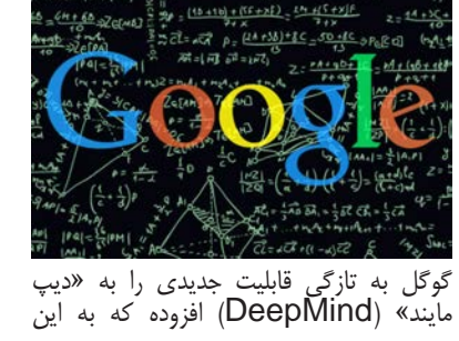
گوگل به تازگی قابلیت جدیدی را به «دیپ مایند» (DeepMind) افزوده که به این

پلتفرم هوش مصنوعی اجازه می دهد در صورت نیاز، به خواب فرو برد. تیم دیپ مایند در وبلاگ رسمی خودش توضیح داده که قابلیت خوابیدن یا چرت زدن، ریشه در تحقیقات علوم عصبی (نوروساینس) دارد و می تواند رویکرد مرسوم کنونی که بر پایه منطق و ریاضیات شکل گرفته را تکمیل نماید. به گفته دیپ مایند بر اساس جدیدترین تحقیقات علوم عصبی، مغز انسان می‌تواند در حین خواب به بازبینی و مرور فعالیت های عصبی قبلی اش