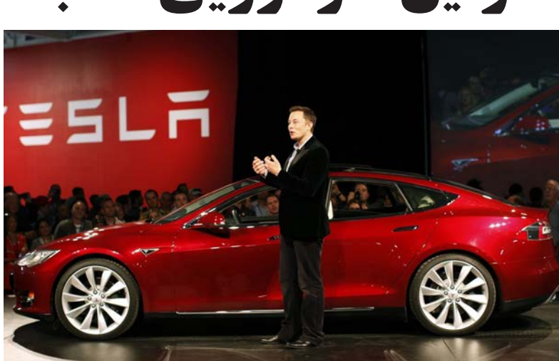
در آن آهنگ Space Oddity دیوید بوئی پخش خواهد شد. ماسک می‌گوید در صورتی که محموله در حین بالا رفتن و سفر به سمت مریخ منفجر نشود، برای میلیاردها سال در فضا باقی خواهد ماند.

ایلان ماسک اعلام کرد اولین پرتاب آزمایشی راکت شرکت اسپیس‌ایکس با محموله‌ای غیرمستعار و مقصدی غیرممکن تا ماه آینده به فضا پرتاب خواهد شد. براساس گزارش CNN، به گفته ایلان ماسک، قرار است این راکت به سمت مریخ حرکت کند درحالی که یک دستگاه خودروی تسلا در رودستر را حمل می‌کند، خودرویی که یکی از مشهورترین آهنگ های دیوید بوئی در این خودرو درحال پخش خواهد بود. براساس توثیق ماسک، این راکت که فالتکون سنگین نامیده می‌شود، از همان سکویی که آپولو ۱۱ از آن پرتاب شد، در مرکز فضایی کندی در فلوریدا به فضا فرستاده خواهد شد. اسپیس‌ایکس صنعت راکت را در جهان متحول ساخته است، اما همزمان با شکست‌هایی مانند انفجار راکت روی سکوی پرتاب و حین پرواز نیز مواجه بوده است. ماسک می‌گوید این راکت با هدف قرار دادن محموله‌اش در مدار مریخ به سمت این سیاره پرواز خواهد کرد. محموله غیرعادی این راکت خودروی سرخ‌رنگ تسلا رودستر متعلق به شخص ماسک است که