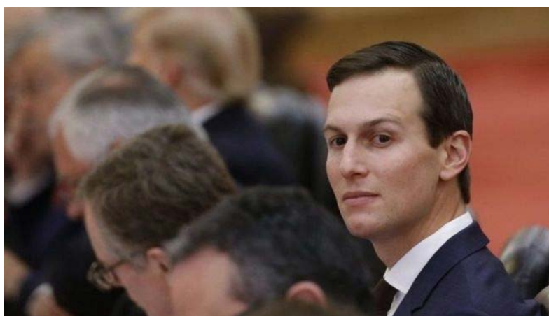
نقلی رسماً بیت‌المقدس را به عنوان پایتخت اسرائیل به رسمیت بشناسد. محمود عباس، رئیس تشکیلات خودگردان فلسطینی در تلاش است تا با جلب حمایت بین‌المللی، آقای ترامپ را قانع کند که از اعلام چنین تصمیمی بپرهیزد.

امین صفدی، وزیر امور خارجه اردن در مورد رسمیت شناختن بیت‌المقدس به عنوان پایتخت اسرائیل هشدار داده است. آقای صفدی در صفحه توئیتر خود نوشته که در گفت‌وگو با ریکس تیلرسون، همتای آمریکایی خود به او گفته است که چنین تصمیمی خشم شدید جهان عرب و دنیای اسلام را بر خواهد انگیزد. این در حالی است که گمانه‌زنی‌ها حکایت از آن دارد که دونالد ترامپ، رئیس‌جمهور آمریکا قرار است بزودی برای عمل کردن به یکی از وعده‌های انتخاباتی خود بیت‌المقدس را به عنوان پایتخت اسرائیل به رسمیت بشناسد، هرچند قصد ندارد سفارت آمریکا را فوراً به این شهر منتقل کند. جارد کوشنر، داماد و نماینده آقای ترامپ در مذاکرات صلح خاورمیانه، گفته است که هنوز در این مورد تصمیمی قطعی اتخاذ نشده است. رسانه‌های آمریکا اخیراً گزارش داده بودند که دونالد ترامپ قصد دارد چهارشنبه این هفته طی