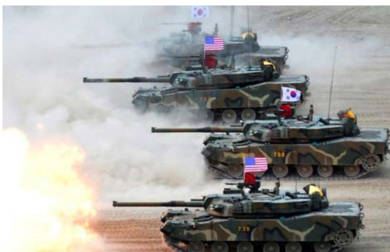
در تازنده‌ترین مورد از این تنشها روز گذشته (شنبه) شب ۲ دسامبر (۱۱ آذر) هربرت مک مستر، مشاور

آمریکا و کره جنوبی از اوایل بهمن ماه روز دوشنبه ۴ دسامبر ۱۳۲۱ آذر مانور مشترک بزرگ نظامی خود را در شبه جزیره کره آغاز کردند. در این تمرین نظامی مشترک سالانه هوایی بین دو کشور، ۲۳ هواپیمای نظامی شرکت دارند از جمله ۶ جنگنده رادارگریز اف-۲۲. این مانور مشترک نظامی چند روز پس از آزمایش موشک بالستیک کره شمالی انجام شده است. تنشها بین آمریکا و کره شمالی در روزها و هفته‌های اخیر و پس از تازه‌ترین آزمایش موشکی کره شمالی، بسیار بالا گرفته است. کمی پیشتر و در آستانه شروع این تمرین‌های بزرگ نظامی مشترک بین آمریکا و کره جنوبی، کره شمالی این دو کشور را به کوبیدن بر طبل جنگ متهم کرد. در همین رابطه سرمقاله روزنامه رودانگ کره شمالی نوشت: این یک عمل کاملاً علنی و تحریک‌آمیز علیه جمهوری خلق دموکراتیک کره است که می‌تواند هر لحظه به جنگ اتمی منجر شود.