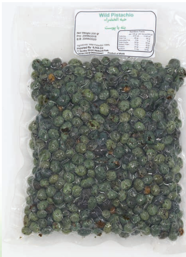
پسته کوهی یا بنه با پوست

ILIYA co Address : 17 Bentley Street Wetherill Park NSW 2164 Australia Tel : 0404559441 ffa_5959@yahoo.com.au