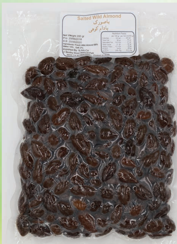
بادام کوهی با پوست