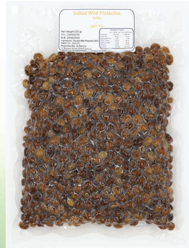
پسته کوهی یا بنه شور