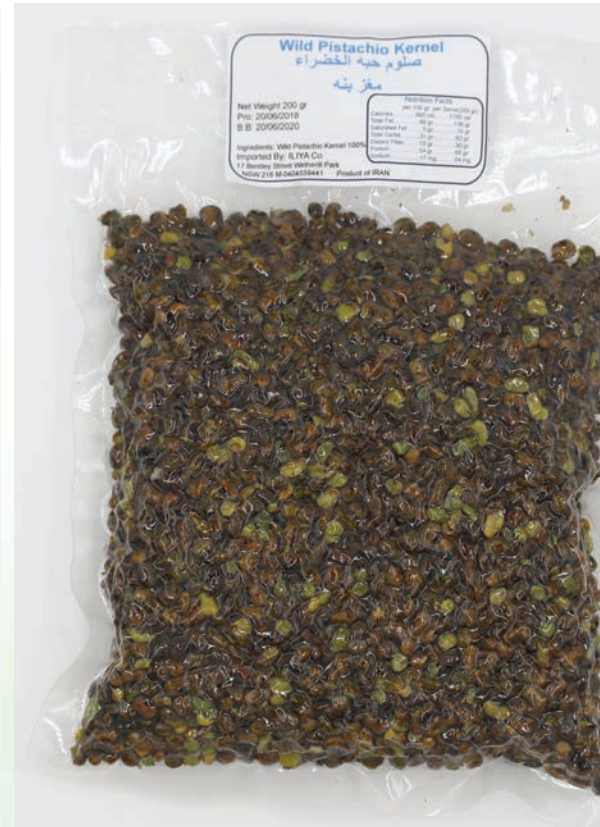
مغز پسته کوهی یا بنه