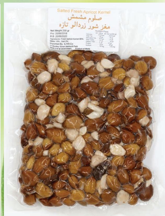
مغز شور هسته زردآلو