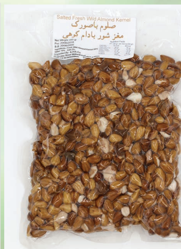
مغز شور بادام کوهی