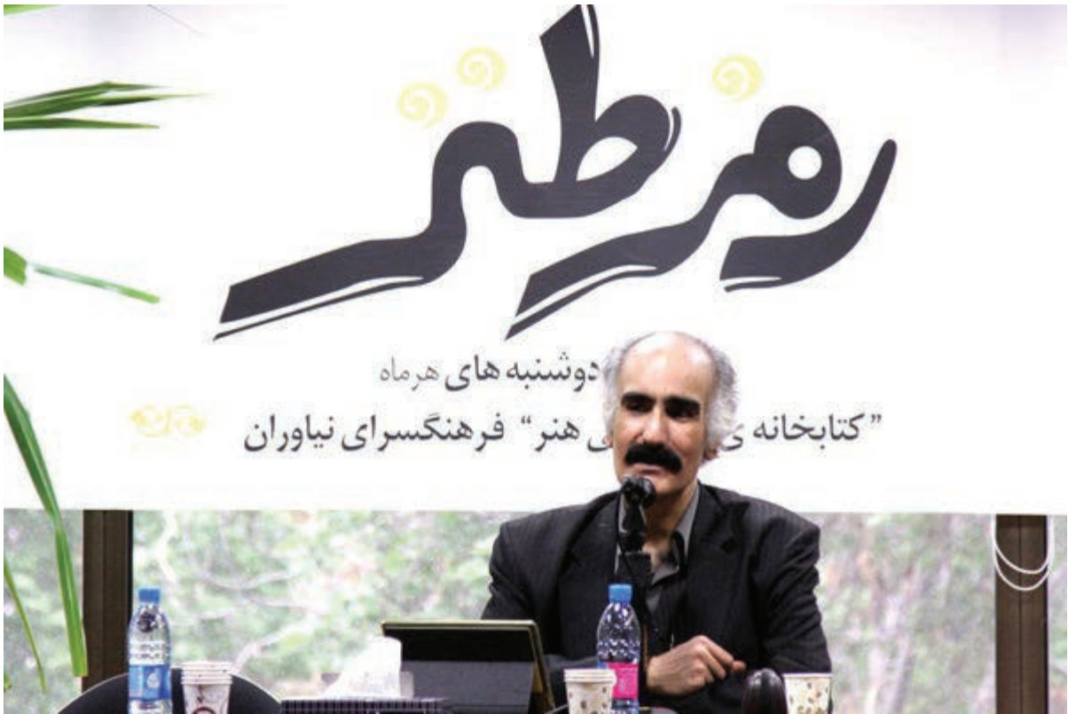
دوشنبه‌های همراه "کتابخانه‌ی هنر" فرهنگسرای نیاوران

من شخصا متقدم خطوط قرمزی وجود ندارم. آدم باید بلد باشد از میان چیزهایی که به آن خط قرمز می‌گویند عبور کند... من می‌گویم با همه چیز می‌شود شوخی کرد.