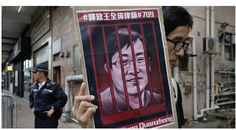
وانگ کوانژانگ، وکیل شناخته‌شده حقوق بشر در چین به چهار سال و نیم زندان محکوم شده است.

وانگ کوانژانگ، وکیل شناخته‌شده حقوق بشر در چین به چهار سال و نیم زندان محکوم شده است. او که به تلاش برای براندازی و تضعیف دولت متهم شده بود به مدت پنج سال از حقوق سیاسی نیز محروم شده است. بنا بر گزارش‌های رسانه‌های جمهوری خلق چین، دادگاهی در شهر تیانجین، وانگ کوانژانگ، وکیل نام‌آشنای حقوق بشری را به جرم تلاش برای براندازی و تضعیف دولت به چهار سال و نیم زندان و پنج سال محرومیت از حقوق سیاسی محکوم کرد. وانگ کوانژانگ که برای دفتر وکالت بسته‌شده فنگ‌روی می‌کرد، وکالت آی وی‌وی، هنرمند معاصر مدافع دموکراسی و نیز قربانیان پرونده‌های مصادره زمین را انجام می‌داد. ژو شیفنگ، مؤسس این دفتر نیز بازداشت و به