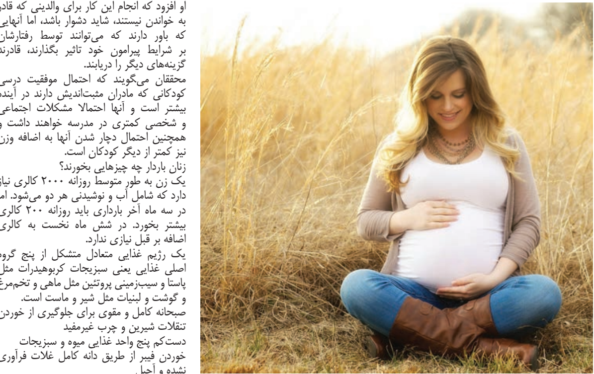
یک زن باردار در حال نوازش شکم خود در یک مزرعه گندم در سوئد.

افزود که انجام این کار برای والدینی که قادر به خواندن نیستند، شاید دشوار باشد، اما آنهایی که باور دارند که می‌توانند توسط رفتارشان بر شرایط پیرامون خود تاثیر بگذارند، قادرند گزینه‌های دیگر را دریابند. محققان می‌گویند که احتمال موفقیت درسی کودکانی که مادران مثبت‌اندیش دارند در آینده بیشتر است و آنها احتمالا مشکلات اجتماعی و شخصی کمتری در مدرسه خواهند داشت و همچنین احتمال دچار شدن آنها به اضافه وزن نیز کمتر از دیگر کودکان است. زنان باردار چه چیزهایی بخورند؟ یک زن به طور متوسط روزانه ۲۰۰۰ کالری نیاز دارد که شامل آب و نوشیدنی هر دو می‌شود. اما در سه ماه آخر بارداری باید روزانه ۲۰۰ کالری بیشتر بخورد. در شش ماه نخست به کالری اضافه بر قبل نیازی ندارد. یک رژیم غذایی متعادل متشکل از پنج گروه اصلی غذایی یعنی سبزیجات کربوهیدرات مثل پاستا و لبنیات مثل شیر و ماست است. صبحانه کامل و مقوی برای جلوگیری از خوردن تنقلات شیرین و چرب غیرمفيد دست‌کم پنج واحد غذایی میوه و سبزیجات نوشه فیبر از طریق دانه کامل غلات فرآوری نشده و آجیل بیش از یک سوم غذا باید به کربوهیدرات شامل برنج، پاستا، سیب‌زمینی و نان اختصاص یابد مصرف روزانه پروتئین شامل گوشت، ماهی و تخم مرغ مصرف دست‌کم دو بار ماهی در هفته که یک بار آن ماهی روغنی مانند سلمون باشد در بخش لبنیات از محصولات کم چرب استفاده شود بیسکویت و نوشیدنی‌های حاوی شکر باید بسیار محدود باشد از میان‌وعده‌های سالم مثل سالاد سبزیجات و سوپ و … استفاده شود زیاد خوردن در حاملگی می‌تواند برای مادر و کودک هر دو مضر باشد.