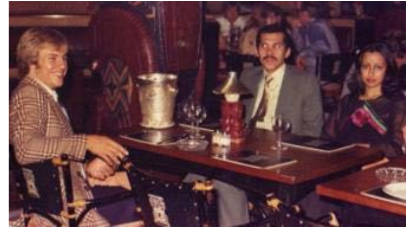
هتل بزرگ کن فرانسه سال ۱۹۷۶. در یک شب داغ تابستان مردی ثروتمند کنار مردی فقیر در آسانسور ایستاد.

مرد ثروتمند، شاهزاده عبدالله بن ناصر نوه بنیان‌گذار عربستان سعودی بود. پسر شهردار سابق ریاض که ثروتی ماورای تصور داشت.