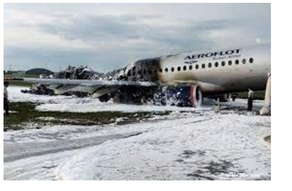
مقام های روسیه مشغول تحقیق روی فرضیه خطای خلبان به عنوان عامل سانحه هوایمائی مسافری در فرودگاه مسکو هستند. هوایمائی سوخوی شرکت ایروفلوت روز یکشنبه (۵ مه/ ۱۵ اردیبهشت) پس از فرود اضطراری در فرودگاه بین المللی مسکو آتش گرفت و دست کم ۴۱ سرنشین آن کشته شدند.

روایتهای مملو از سوخت تصمیم متداولی به شمار نمی آید. ویدیویی در توئیتر منتشر شده است که نشان می دهد مسوولان ایروفلوت در حین تماشای این سانحه شوخی می کنند. فرودگاه شرمیتوو در بیانیه ای اعلام کرده است که این مسوولان نه به فرودگاه و نه به شرکت ایروفلوت تعلق دارند و خواستار تنبیه آن ها به اتهام تخلف از اخلاق حرفه ای شده است. در این ویدیو، صدای خنده شنیده می شود و یکی از آنها می گوید: «بی دردرس نشست. با یک شمله کوچک»، در حالی که روی صفحه نمایش آتشی چگنی هوایما را در بر گرفته است. پس از آنکه هوایما، با ۷۸ سرنشین، در باند فرودگاه شرمیتوو در مسکو متوقف شد شمله های آتش بدنه آن را فرا گرفت و ستون عظیم دود از آن به هوا برخاست. ویدئوهایی که در شبکه های مجازی منتشر شد نشان می دهد مسافران با سرسره نجات از هوایما خارج شدند. مقامات فلسطینی و مصری می گویند که توافق بر سر آتش بس به مدت آمده و از ساعت ۴ و نیم صبح به وقت محلی به اجرا گذاشته شده است. بنیامین نتانیاهو، نخست وزیر اسرائیل روز گذشته دستور داده بود تا ارتش این کشور به شدت به حملات خود به نوار غزه و در پاسخ به راکت هایی که از این منطقه به خاک اسرائیل پرتاب می شود، ادامه دهد. این اولین بار در پنج سال گذشته است که حملات مرگباری از غزه به خاک اسرائیل انجام شده است. ماه گذشته، آتش بسی با میانجیگری مصر برقرار شد، اما حماس بعداً اسرائیل را به نقض مفاد این آتش بس متهم کرد. درگیری های اخیر پس از آن آغاز شد که روز