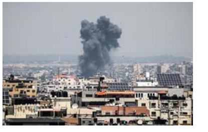
بر اساس گزارش ها با واسطه مصر آتش بس در نوار غزه برقرار شده است.

مقامات فلسطینی و مصری می گویند که توافق بر سر آتش بس به مدت آمده و از ساعت ۴ و نیم صبح به وقت محلی به اجرا گذاشته شده است. بنیامین نتانیاهو، نخست وزیر اسرائیل روز گذشته دستور داده بود تا ارتش این کشور به شدت به حملات خود به نوار غزه و در پاسخ به راکت هایی که از این منطقه به خاک اسرائیل پرتاب می شود، ادامه دهد. این اولین بار در پنج سال گذشته است که حملات مرگباری از غزه به خاک اسرائیل انجام شده است. ماه گذشته، آتش بسی با میانجیگری مصر برقرار شد، اما حماس بعداً اسرائیل را به نقض مفاد این آتش بس متهم کرد. درگیری های اخیر پس از آن آغاز شد که روز