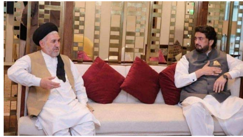
ایران بحث کردند. این نشست سالانه با هدف رسیدگی به وضعیت مهاجران افغان در کشورهای

بر اساس آمار وزارت مهاجران پاکستان، از آغاز سال ۲۰۰۲ تا کنون حدود چهار و نیم میلیون اتباع افغانستان به گونه داوطلبانه از پاکستان به کشورشان برگشته‌اند. وزارت مهاجران افغانستان می‌گوید در حال حاضر حدود ۲ میلیون مهاجر افغان در پاکستان و بیش دو نیم میلیون مهاجر دیگر در ایران زندگی می‌کنند.