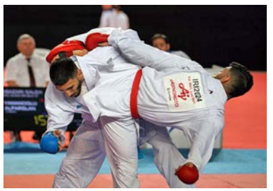
به گزارش سایت فدراسیون کاراته، شانزدهمین دوره رقابت های کاراته قهرمانی آسیا طی ۳ روز

الجزایر باقی بازی را در حالت تدافعی به سر برد تا برای اولین بار از سال ۱۹۹۰ برنده این جام شود. بازیکنان سنگال با به صدا در آمدن سوت پایان