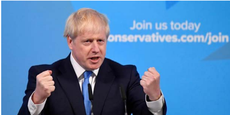
عضای حزب حاکم محافظه‌کار بریتانیا بوریس جانسون، وزیر خارجه سابق را با اکثریت قاطع آراء به رهبری حزب و جانشینی ترزا می، نخست وزیر، انتخاب کردند.

انتظار می‌رود روز چهارشنبه، ۲۴ ژوئیه/۲ مرداد با کناره‌گیری رسمی ترزا می از مقام نخست وزیر، ملکه بریتانیا بوریس جانسون را به این سمت منصوب کند. لحظاتی پس از اعلام نتیجه رای‌گیری، دونالد ترامپ، رئیس جمهوری آمریکا، در توئیتر خود این انتخاب را تبریک گفت و افزود: او عالی خواهد بود. آقای ترامپ همواره نظر مساعدی نسبت به بوریس جانسون داشته است.