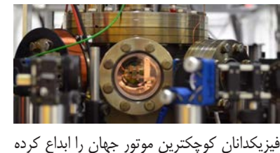
فیزیکدانان کوچکترین موتور جهان را ابداع کرده

اند که به اندازه یک یون کلسیم است. به نقل از فیوچرسم، فیزیکدانان کالج ترینتی دولین ادعا می‌کنند کوچکترین موتور دنیا را ساخته‌اند. این موتور به اندازه یک یون کلسیم است. به عبارت دیگر موتور مذکور حدود ۱۰ میلیارد بار کوچکتر از موتور خودرو است. البته چنین موتوری در خودروها کاربرد ندارد اما در آینده زیربنایی