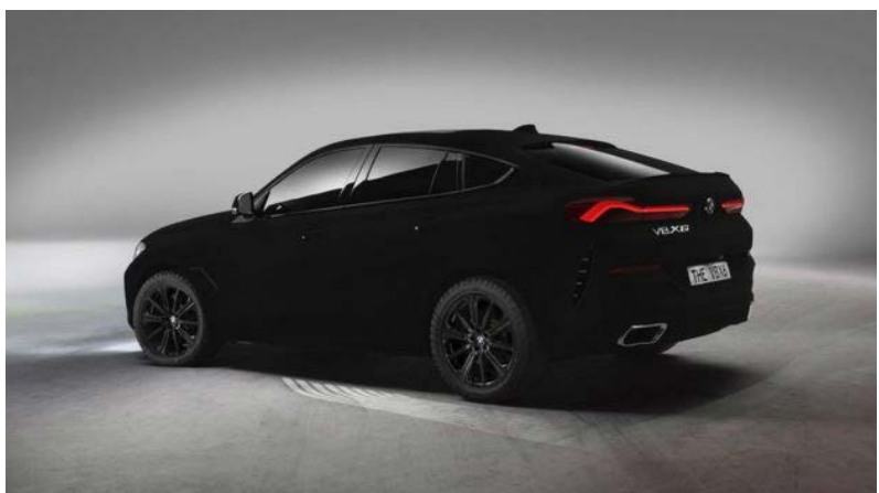
بالاتر از سیاهی ایده ساخت یک شاسی‌بلند کوپه بیش از ده سال پیش برای اولین بار توسط بامو اجرا شد و بامو X6 برای چند سال تنها شاسی‌بلند کوپه در بازار بود.