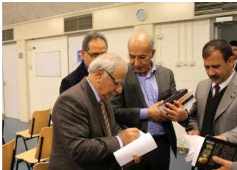
بیرک ارغند، داستان‌نویس افغانستان چندی قبل در هلند درگذشت. او از جمله پیش‌کسوتان داستان‌نویسی در افغانستان بود. از آقای ارغند پیش از ده اثر بجا مانده که می‌توان از مجموعه داستان‌های دشت الوان، دفترچه سرخ، مرجان و رمان‌های پهلوان مراد و اسپه که اصیل نبود، کتربازان، سفر پرده‌گان بی‌بال، لیخند شیطان و چندین آثار دیگر اشاره کرد.

بیرک ارغند در سال ۱۹۴۹ در شهر کابل به دنیا آمد و تحصیلات ابتدایی خود را به ترتیب در ولایات بلخ، کابل و قندهار به پایان رساند و دانشکده ادبیات و علوم انسانی وقت را در دانشگاه رمان‌های پهلوان مراد و اسپه که اصیل نبود، کتربازان، سفر پرده‌گان بی‌بال، لیخند شیطان و چندین آثار دیگر اشاره کرد. بیرک ارغند در سال ۱۹۴۹ در شهر کابل به دنیا آمد و تحصیلات ابتدایی خود را به ترتیب در ولایات بلخ، کابل و قندهار به پایان رساند و دانشکده ادبیات و علوم انسانی وقت را در دانشگاه رمان‌های پهلوان مراد و اسپه که اصیل نبود، کتربازان، سفر پرده‌گان بی‌بال، لیخند شیطان و چندین آثار دیگر اشاره کرد. بیرک ارغند در سال ۱۹۴۹ در شهر کابل به دنیا آمد و تحصیلات ابتدایی خود را به ترتیب در ولایات بلخ، کابل و قندهار به پایان رساند و دانشکده ادبیات و علوم انسانی وقت را در دانشگاه رمان‌های پهلوان مراد و اسپه که اصیل نبود، کتربازان، سفر پرده‌گان بی‌بال، لیخند شیطان و چندین آثار دیگر اشاره کرد. بیرک ارغند در سال ۱۹۴۹ در شهر کابل به دنیا آمد و تحصیلات ابتدایی خود را به ترتیب در ولایات بلخ، کابل و قندهار به پایان رساند و دانشکده ادبیات و علوم انسانی وقت را در دانشگاه رمان‌های پهلوان مراد و اسپه که اصیل نبود، کتربازان، سفر پرده‌گان بی‌بال، لیخند شیطان و چندین آثار دیگر اشاره کرد.