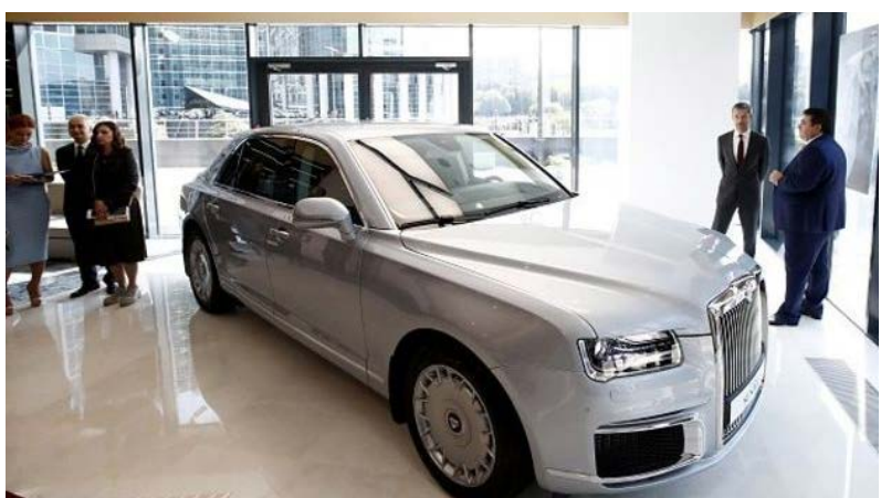
ظاهری شباهت زیادی به رولزرویس فانتوم دارد، اما پولش کمتر و ارتفاعش کمی بیشتر است.