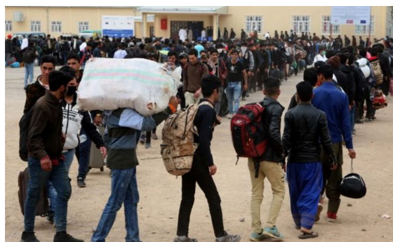
پهداشت این سازمان در گذرگاه‌های مرزی ایران در زمینه ارائه خدمات بهداشتی و آگاهی‌دهی در مورد بیماری کووید ۱۹ موظف شده‌اند.