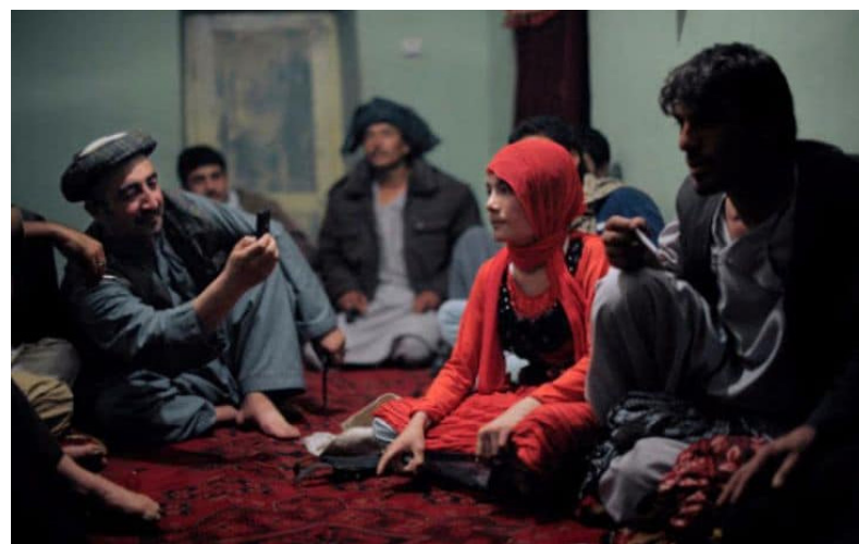
می‌کنند، به خاطر نبود حمایت مناسب، نهادهای غیردولتی نیز نمی‌توانند قاچاقچیان انسان را برای اجرای قانون گزارش دهند.

وزارت خارجه آمریکا درباره ادعای قاچاق ۱۶۵ کودک در ولایت لوگر به منظور استفاده جنسی، از تحقیق دادستانی افغانستان و شناسایی ۲۰ نفر در این ارتباط یاد کرده و آورده که در هنگام تدوین این گزارش ۹ نفر بازداشت و دو نفر محکوم شده‌اند.