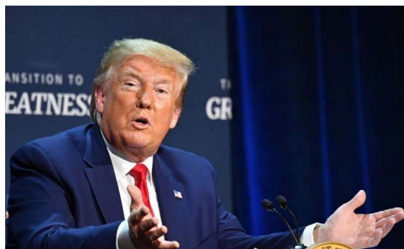
پیشتر سخنگوی آقای ترامپ گفته بود این نکته که آقای ترامپ در جریان این اطلاعات

در سال ۲۰۱۹ حدود ۲۰ سرباز آمریکایی در افغانستان کشته شدند، اما هنوز روشن نیست که کدام یک از این کشته‌شدگان ممکن است به این خاطر بوده باشد. دیمیتری پسکوف، از سخنگویان ولادیمیر پوتین، رئیس‌جمهور روسیه نیز به نیویورک تایمز گفته که کاخ کرملین از این اتهامات باخبر نبوده است. طالبان این موضوع را رد کرده و گفته "این نوع ارتباط با سازمان استخبارات روسیه بی اساس" است. آقای مجاهد تاکید کرده که پس از امضای توافقنامه صلح با آمریکا، سربازان آمریکایی "در امان هستند و ما به آنها حمله نمی‌کنیم".