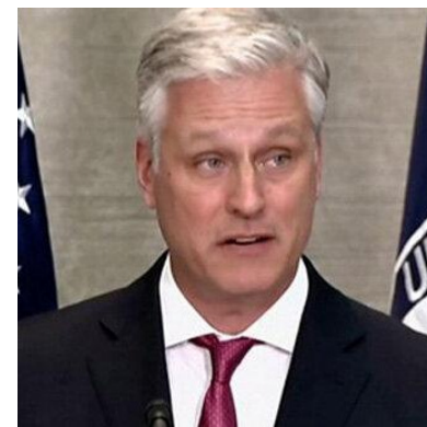
رابرت اوبراین، مشاور امنیت ملی کاخ سفید، ارشدترین مقام دولت امریکاست که تاکنون نتیجه تست کرونا او مثبت اعلام شده است.

کاخ سفید می‌گوید او علایم خفیفی بروز داده و اکنون در قرنطینه خانگی است. کاخ سفید می‌گوید «هیچ خطری دونالد ترامپ و مایک پنس، معاونش را تهدید نمی‌کند.» رابرت اوبراین، ۵۴ ساله، بعد از جدایی جان بولتون از کاخ سفید جایگزین او شد. هنوز معلوم نیست که آخرین ملاقات رو در روی او با دونالد ترامپ یا مایک پنس چه زمانی روی داده است. اما مقام‌های کاخ سفید می‌گویند «چند روزی» از آخرین حضور آنها در کنار هم می‌گذرد. آقای اوبراین دو هفته پیش در جریان سفر دونالد ترامپ به میامی در جنوب فلوریدا، همراه او بود. روز دوشنبه، ۲۷ ژوئیه، کاخ سفید با انتشار بیانیه‌ای ضمن تأیید مثبت بودن تست کرونا آقای اوبراین گفت: «او علایم ملایمی دارد و اکنون در مکان مطمئن و خارج از کاخ سفید