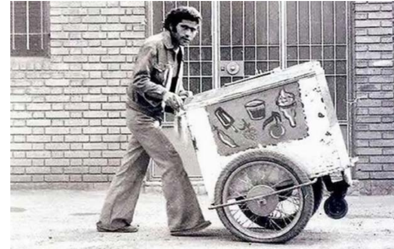
تصویری ناب از یک آلاسکا فروش دوره گرد تهران - تابستان ۱۳۵۵